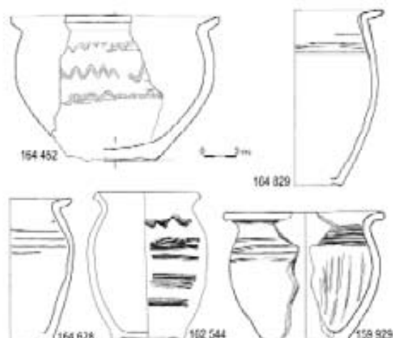
Obr. 1. Nádoby malých objemů z Uherského Hradiště, Otakarovy ulice. Kresba K. Vytejková.

Abb. 1. Gefäße mit geringem Fassungsvermögen aus Uherské Hradiště, Otakar-Str. Zeichnung K. Vytejková.