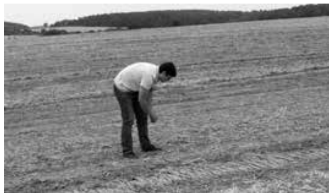
Obr. 4: Povrchový sběr na lokalitě Ondratice II – Zadní hony.

Z okolních zemí byla metoda povrchových sběrů nejdříve uplatněna v Polsku, kde jsou postupně od roku 1978 prozkoumávány všechny dostupné plochy v rámci projektu