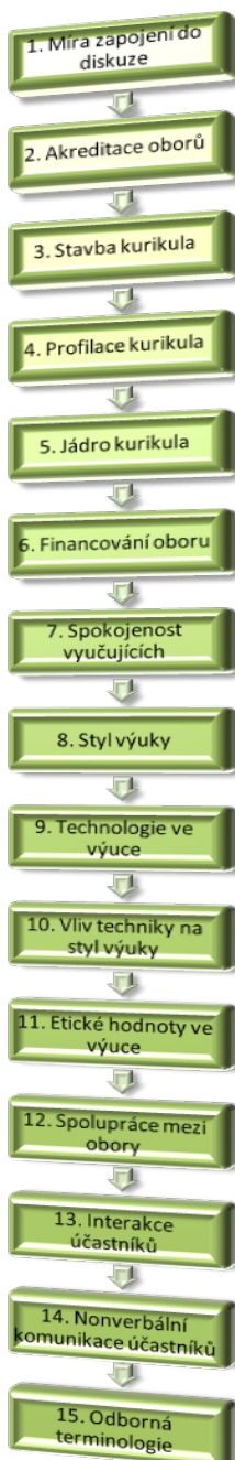
Graf 1 Vlákno analyzovaných témat