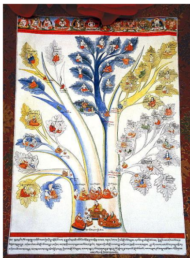
Obr. 1 Tibetská medicína: strom určení diagnózy