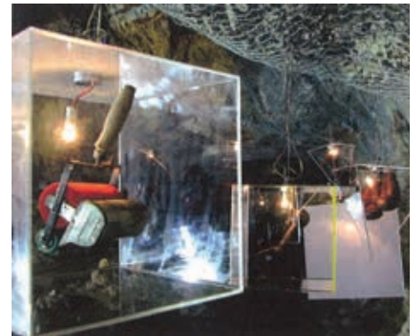
Abb. 1: Blick in einen der Ausstellungsräume im Stollensystem des Schlossberges im Rahmen der Ausstellung „Berg der Erinnerungen“. Bildnachweis: HOFGARTNER, Heimo, Katia SCHURL und Karl STOCKER. Berg der Erinnerungen. Die Geschichte der Stadt ist die Geschichte ihrer Menschen. Katalog zur Ausstellung im Stollensystem des Grazer Schloßberges (22. März bis 28. September 2003), Graz 2003, S. 17.

quellenwissenschaftlichen Forschung und der daraus resultierenden musealen Vermittlung beschäftigt, zu den größten Herausforderungen der Disziplin. Die lapidare Reduktion auf Anwendungsorientierung ohne Rückkopplung zu theoretischen Modellen ist ebenso fehlgeleitet wie – umgekehrt – theoretische Konzepte nicht umsetzbar sind, wenn diese den alltäglichen Sachzwängen der Museumsarbeit und den Besucherbedürfnissen nicht gerecht werden.