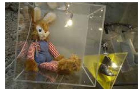
Abb. 2: Erinnerungsobjekt in einer Vitrine im Rahmen der Ausstellung „Berg der Erinnerungen“.

Das seit dem Jahr 2007 als „SÜDBAHN Museum Mürrzuslag“ bezeichnete „Innenraum-Museum“ befindet sich unmittelbar an der seit 1844 hier befahrenen Südbahn. (Abb. 2)