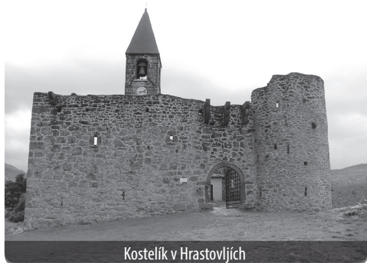
Kostelík v Hrastovljah

Slovinské moře taky není jen Koper, Piran a Portorož, ale své kouzlo mají i blízké vesničky s typickými istrijskými domy s nízkými střechami. Vesměs nevelké visky, které slouží spíše jako satelitní vesnice pro přímořská letoviska, jsou v posledních dvou desetiletích postupně ožívány novými restauracemi, penzionky, ale i muzei tradičních řemesel (muzeum výroby olivového oleje v obci Sveti Peter, Živi muzej v Krkavcích aj.). Anebo zajít do chládku hrastoveljského kostelíka s freskami Tance smrti.