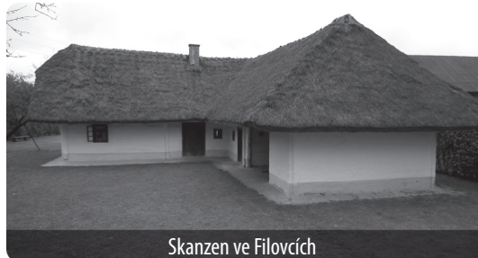
Skanzen ve Filovcích

hradů a zámků sloužila k nejrůznějším účelům od úřadů po ústavy či domovy důchodců apod., což některé více, některé méně zásadním způsobem poznamenalo. Některé z nich si po r. 1991 našly nové majitele, kteří je postupně rekonstruují, ať za státní či za soukromé peníze, ale často jde o proces velmi zdlouhavý. Navíc je mnohdy problém u těchto staveb najít šetrné a rozumné využití a jejich prostor oživit a otevřít lidem. K běžným turistickým prohlídkám se kvůli ztracenému nebo zničenému mobiliáři ne vždy hodí. Někdy jsou využívány jako sídla místních muzeí (Brežice, Kamnik aj.).