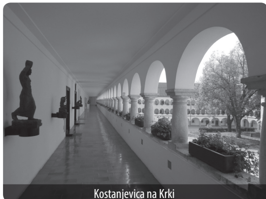
Kostanjevica na Krki

významných měšťanů z Celeie z 2. a 3. stol. n. l. Dnes jde zřejmě o nejvýznamnější památku antickeho původu ve Slovinsku. Stačí tu jen odbočit na chvilku z dálnice a přenést se o 2000 let nazpátek. V příbězích reliéfů vás obklopí svět anticke mytologie i dojemné privátní příběhy zdejších římských rodin.