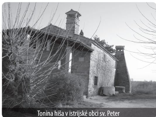
Tonina hiša v istrijské obci sv. Peter

kův chrám v Bogojině, ale taky třeba miniskanzen s muzeem hrncířství ve Filovcích. Většina kostelů normálně přístupná není, ale stojí za to si přivstat a zajít sem na ranní bohoslužbu a jednou si architekturu užívat v tom kontextu, pro jaký byla vytvořena, ne pro blýskání turistova fotoaparátu, ale jako dům modlitby.