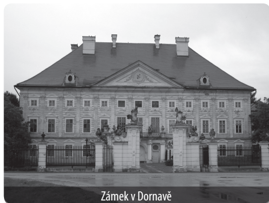
Zámek v Dornavě