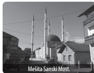
Mešita Samski Most.

Tento text vznikl za podpory grantu GAČR č. P410/10/0136.