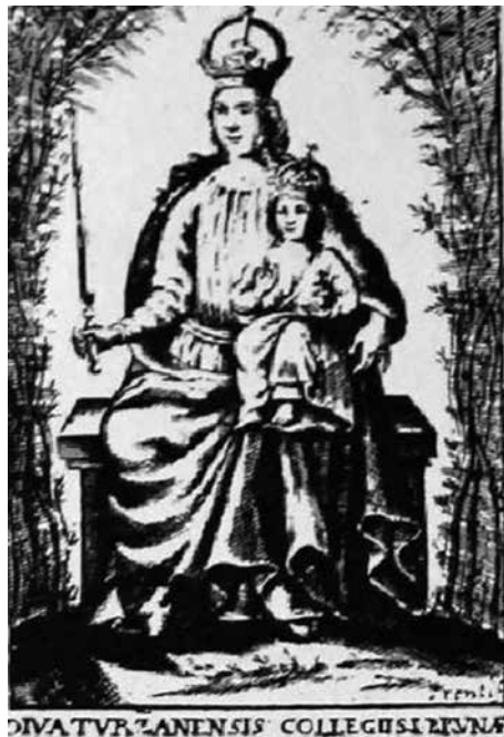
Obr. 10. Panna Marie Tuřanská, Jan Kryštof Prentl, 2. polovina 17. století (před rokem 1689). Podle Royt 1993, obr. na s. 19.

Ikograficky se jedná o typ Agiosoritissa, který byl v Itálii uctíván zejména prostřednictvím milostného obrazu v Ara Coeli v Římě. Napravo skloněná hlava a gesto ruky ve znamení přimlvy odkazují právě na tento obraz a také na původní byzantské předlohy (Aurenhammer 1956, 102).