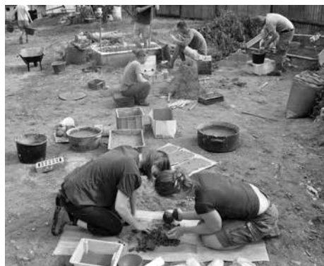
Obr. 1. Experimenty probíhající na zahradě vědecko-výzkumné stanice v Panské Lhotě (2015).

V letech 2015 a 2016 se v Panské Lhotě u Jihlavy na vědecko-výzkumné stanici Ústavu archeologie a muzeologie Filozofické fakulty Masarykovy univerzity (dále jen ÚAM) uskutečnily dva workshopy ke středověké a novověké keramice. Workshopy zaměřené na otázky výzkumu středověké a novověké keramiky a na její experimentální výrobu se v Panské Lhotě konají již od roku 2012 (obr. 1; Doležalová–Těsnohlídek–Slavíček–Mazáčková 2015; Doležalová–Mazáčková 2013). V roce 2015 tyto workshopy poprvé doplnil publikační výstup a účastníkům obou workshopů bylo umožněno publikovat příspěvky v supplementech ediční řady Dissertationes Archaeologicae Brunenses/Pragensesque pod názvem Workshopy ke středověké a novověké keramice, Panská Lhota 2015 . Sborník