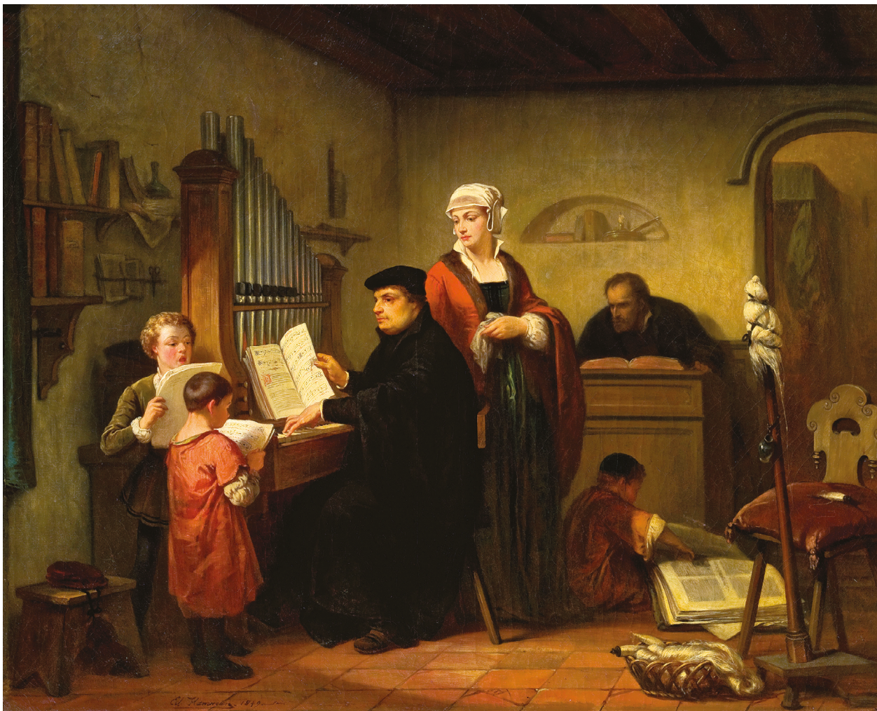
1 – Edouard Hamman, Martin Luther při hře na varhany v kruhu své rodiny, 1849. 1854–1871 Brno, sbírka Ernsta Johanna svobodného pána Herringa; 2009 Vídeň, Kinsky Kunstauctionen.