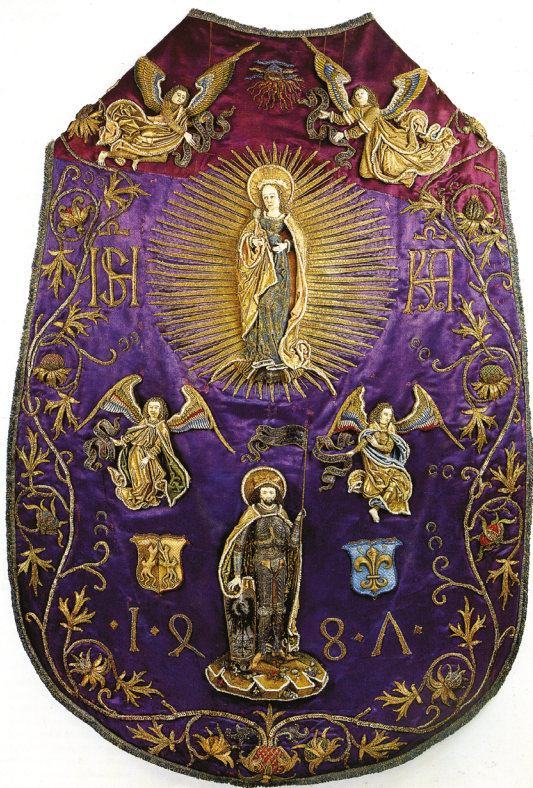
3 – Kasule se svatým Václavem, české země, 1487. 1862 Brno, chrámový poklad brněnské kapituly sv. Petra a Pavla; dnes Moravská galerie v Brně