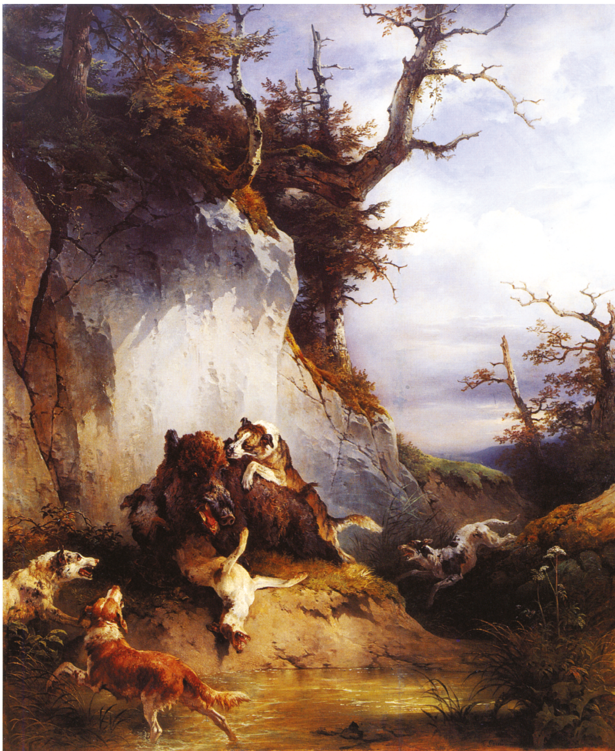
2 – Friedrich Gauermann, Lov na kance , 1851. 1852–1898 Brno, majetek výboru první městské části; od 1977 Moravská galerie v Brně (od 1898 obrazárna Františkova muzea)