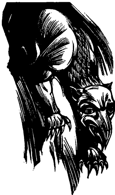
42. Koncovka z knihy V. Huga Géniové, dřevoryt, 1951, č. kat. 526

Maliřské a prostorotvorné možnosti bílé bez pomoci metod iluzionismu Lacinu nepochybně lákají v souvislosti s jejím „magickým“ působením na člověka. Ostatně problém práce s barvou, ale i s tvarem vyplývá z kompozice, kterou podmiňuje právě význam. Celé jeho dílo lze v podstatě rozdělit na obrazy kompozičně uzavře-