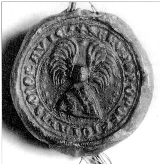
Jezdecká pečeť Jezdecká pečeť knížete Mikuláše I. Opavského, levobočného syna krále Přemysla Otakara II., přivěšená k listině opolského vévody Kazimíra z 10. ledna 1289 (AČK Praha). knížete Mikuláše I. Opavského, levobočného syna krále Přemysla Otakara II., přivěšená k listině opolského vévody Kazimíra z 10. ledna 1289 (AČK Praha).

1238 se ovšem brněnský komorník jmenuje Budislav a má dokonce zástupce, podkomorníka, jímž není nikdo jiný než znojemský purkrabí Boček. 315 Ve falzu s datem 2. ledna 1255, jehož údaje však náležejí spíše 40. létům 13. století se objevuje komorník Karel, 316 v pravé listině z 16. června