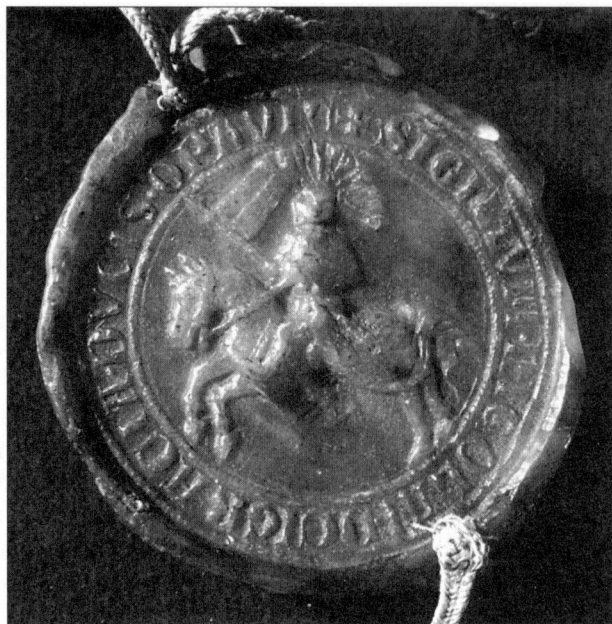
Jezdecká pečeť knížete Mikuláše I. Opavského, levobočného syna krále Přemysla Otakara II., přivěšená k listině opolského vévody Kazimíra z 10. ledna 1289.

předseda královský vilik, 287 naprosto odpovídá znění smlouvy z formulářové sbírky. Na Opavsku byla šetřena práva krále i vévody. Do jara 1288 se však již situace uvnitř českého státu změnila natolik, že zřejmě nebylo nutné situaci řešit pomocí komplikovaného prostřednictví římského krále.