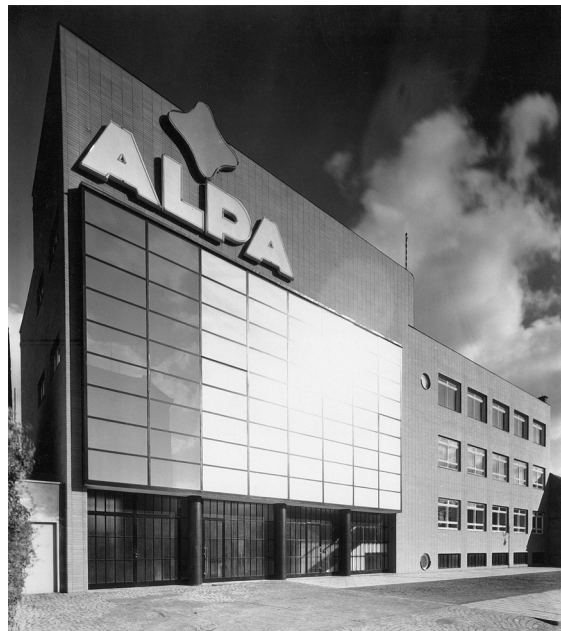
Obr. 13: Bohuslav Fuchs, administrativní budova firmy Alfa v Brně-Králově Polí, 1936.

ky stanovené proporční relace a schémata u něho prakticky neexistovaly, každá stavba byla pro něho výzvou k experimentu. Dochovaná plánová a písemná dokumentace svědčí o tom, že proces navrhování nechápal jako naplnění apriorní vize. Mnohé výkresy působí téměř nehotově a postrádají některé charakteristické prvky realizovaného díla. Zejména u rodinných domů podroboval výchozí koncepci těsně před realizací i během ní dílčím změnám. Některá řešení vypadají jako kdyby architekta výtvarné problémy téměř nezajímaly, avšak v rozhodujícím okamžiku reagoval na situaci s jediným smyslem pro dokonalou geometrickou abstrakci. Pozoruhodné jsou neustálé proměny proporcí, které vyvolávají dojem, že nejsou pro tvůrce podstatné, nakonec však nečekaný zásah často posunul vzhled celé stavby. Fuchsova abstrakce směřovala k nastavení nepatrného, na první pohled nepochopitelného posunutí proporcí mimo