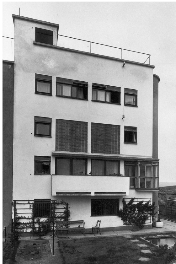
Obr. 10: Bohuslav Fuchs, zahradní průčelí vlastního rodinného domu na Hvězdárenské ulici v Brně-Žabovřeskách, 1927–1928.