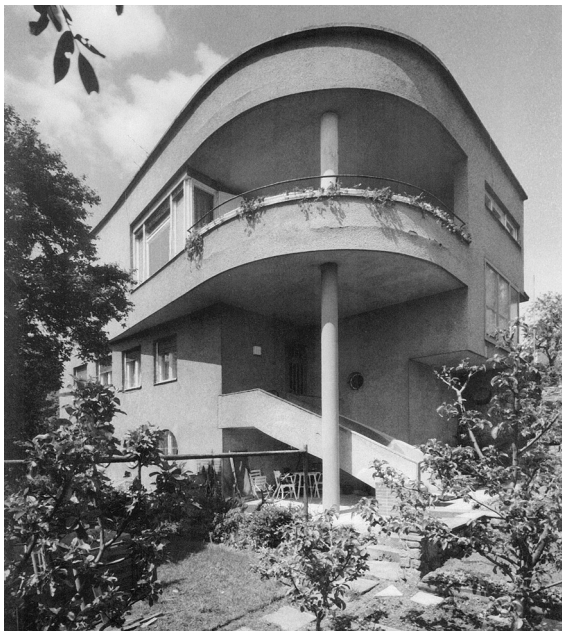
Obr. 12: Bohuslav Fuchs, Petrakova vila v Brně-Pisárkách, 1936.