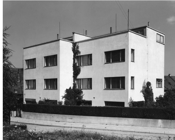
Obr. 11: Bohuslav Fuchs, rodinný dvojdům na Lužické ulici v Brně-Žabovřeskách, 1928.

Souběžně s Petrákovou vilou vznikla také Fuchsova administrativní budova firmy Alpa v Brně-Králově Poli. Levou vyšší polovinu jejího uličního průčelí ovládá rozměrná skleněná stěna, jejíž menší část nad průjezdem je transparentní a zbývající větší část pouze zdánlivě transparentní. Na skleněný panel dosedá těžká atika, v místě napojení na zbývající část budovy tvarovaná segmentově, jejíž masivnost ještě podtrhuje předdimenzovaný firemní znak. Dojem