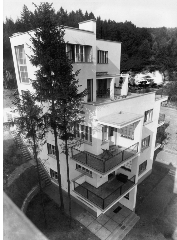
Obr. 6: Bohuslav Fuchs, penzion Radun v Luhačovicích, 1927.

Zároveň s penzionem Radun vytvořil Fuchs Kropáčovo sanatorium v Brně, u něhož dvěma mírně nakoso postavenými rizality, svisle probraným nárožím i válcovým okapním svodem zdůraznil vertikalitu. Fasády prolomil okny několika formátů, která se rytmicky střídají a místy vytvářejí náznak symetrie. Stěžejní motiv fasády tvoří rizalit s balkonem, umístěným na nároží budovy v prvním patře. Rizalit je navzdory proskleným nárožím klasicizující, však balkon, který z něj vybíhá, dodává kompozici náznak pohybu a rotace a zároveň