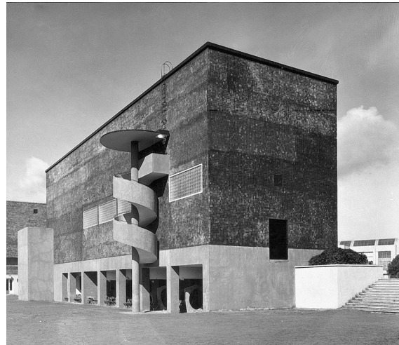
Obr. 3: Bohuslav Fuchs, zadní průčelí výstavního pavilonu města Brna na zemském výstavišti v Brně, 1927–1928.