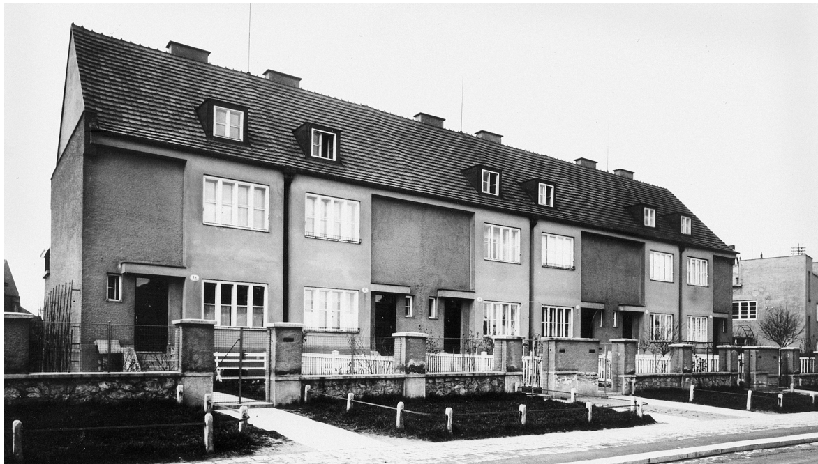
Obr. 1: Bohuslav Fuchs, rodinné domy družstva Rodina na Barvičově ulici v Brně-Masarykově čtvrti, 1923.

ci, působit na vývoj moderních konstrukcí, ale chce přímo ve svých dílech vyjadřovat ducha doby, její tvárný cit. Je vždycky v nebezpečí falešných impulzů nebo tradičních vlivů. Architekturu chápe jako individualistický výtvarný projev. Východiskem mu byla Kotěrova škola“. 4