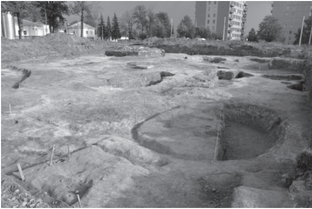
Obr. 45. Jihlava – lokalita Staré Hory III. Pohled na výzkumnou plochu směrem k jihovýchodu na podzim 2006.

kou důlní jámu, přičemž lze předpokládat např. praní za účelem zkoušky obsahu rud v těžené žilovině, její kovnatosti apod. Jde o skupinu objektů převážně obdélného nebo čtvercového tvaru, jejichž rozměry a hloubky se pohybovaly v nevelkém rozpětí. Hrany v úrovni skrývky byly zpravidla rovné, dno rovněž. Za nádržky lze považovat také téměř dokonale kruhové objekty s miskovitým dnem nebo objekty pravidelně oválné s náznaky rohů, jejichž obdélnou základnu lze připustit. U některých těchto objektů byly pozorovány pozůstatky dřevěných stěn či dna v podobě humózních, dřevitých, pravidelných a tenkých vrstviček. U geochemicky analyzovaných výplní nebo hmot vrstev pod dnem byly zpravidla zjištěny nenáhodně zvýšené koncentrace těžkých kovů. Z hlediska vnější kritiky pramene je nutné u této i následující skupiny kanálů, koryt a žlabů za všech okolností brát v potaz skutečnost, že archeologický výzkum zachytil pouze ty z nich, které byly zahloubené pod úroveň terénu. Nadzemní části se nedochovaly. V jednom případě byly nalezeny pozůstatky zařízení, u něhož byl základní obdélný tvar doplněn hustou řadou kůl s ploše seříznutými konci.