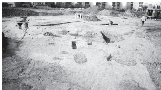
Obr. 44. Jihlava – Staré Hory, lokalita I. Pohled na část archeologického výzkumu sídlištního a úpravnického okrsku na podzim roku 2002.

Haldovina: Charakterizuje se jako uloženina (vrstva), která byla pozorována v následujících prostorových situacích a vztazích: a) hlavní uloženina v bázích zaniklých obvalů okolo šachet, b) sekundární výplň ve většině archeologicky zkoumaných objektů, zejména v důlních jamách, c) volně se v terénu vyskytující vrstva jako produkt pozdějších aplanačních a rekultivač-