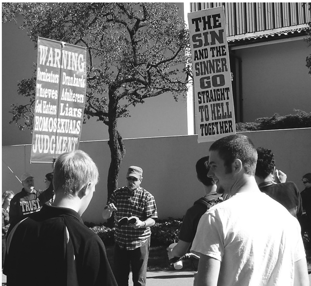
Obr. č. 5: Další skupinou, která je řazena mezi náboženské outsidersy a využívá toho postavení, jsou křesťanští fundamentalisté.

náboženství v Evropě. 51 Zároveň s tím poukazují na to, že v mnoha ohledech je použití těchto kategorií velmi problematické a jako příklad uvádí např. lutherány, kteří se „nevejdou“ ani do jedné z těchto kategorií.