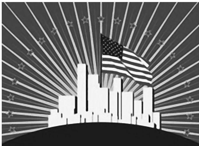
Obr. č. 2: Jedno ze současných vyobrazení USA jako města na pahorku.