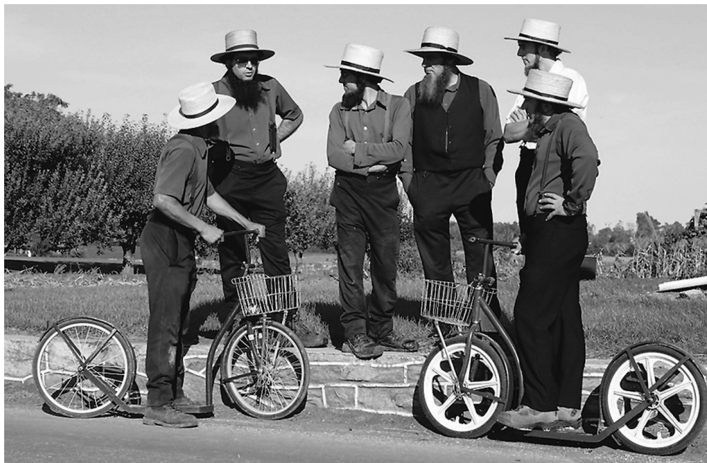
Obr. č. 4: Jednou z nejznámějších náboženských skupin, které reprezentují Mooreův koncept outsidera, jsou vedle mormonů také amishové. Zdroj: Amish men on scooters via last fm . In: Anglican, plain [online] 15. 5. 2011. [vid. 2013-11-10]. Dostupné z: http://magdalenaperks.wordpress.com/2011/05/15/amish-scooters-again/

Vedle uvedených inspiračních zdrojů sehrála důležitou roli při formulaci Mooreovy verze konfliktualistického paradigmatu strukturalistická a poststrukturalistická analýza normality a deviance. S odkazem na práce Kaie Eriksona 45 či Howarda Beckera 46 je totiž přesvědčen, že časté označování outsiderů jako reprezentantů „ne-normality“ a deviance je součástí mocenského procesu arbitrární stigmatizace, během které mocensky dominantní skupiny sociálního řádu vymezují hranice. 47 Konkrétním příkladem, na němž Moore nejčastěji demonstruje své závěry, je Církev Ježíše Krista svatých posledních dní ( Church of Jesus Christ Latter Days Saints – zkráceně Latter Days Saints /LDS/). 48 Právě