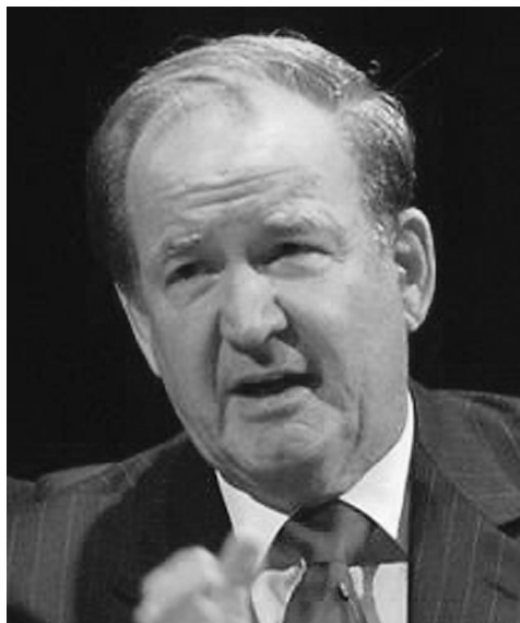
Obr. č. 37: Patrick Buchanan (nar. 1938).