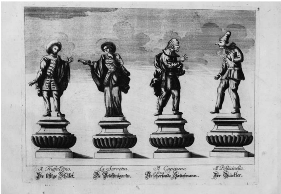
Abb. 18 und 19: Salomon Kleiner: Figuren der Wälschen Comedie (Wienbibliothek im Rathaus, Sign. 5737-C)