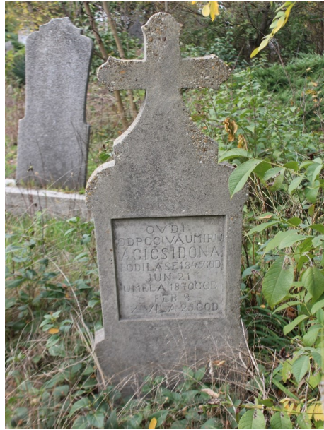
Abb. 3: Grabmal von Idona Agičs

um die Grabstätten von Angehörigen zu beschriften. Im 20. Jahrhundert lässt sich dann allmählich ein Übergang zum Ungarischen feststellen, was aber bleibt sind an zahlreichen Stellen die Namen, die auf eine südslavische Herkunft einzelner Personen hindeuten. Sie können heute etwa an Kriegsdenkmälern abgelesen werden.