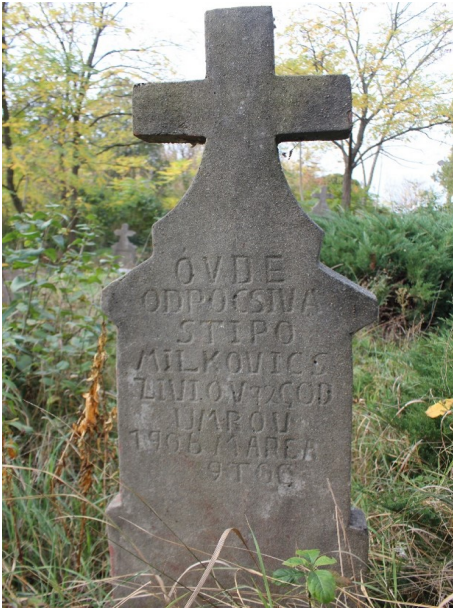
Abb. 4: Grabmal von Stipo Milkovics