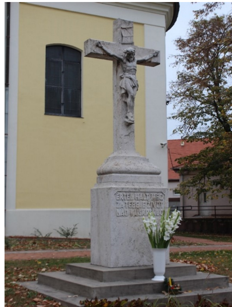
Abb. 7: Kruzifix an der Römisch-katholischen Kirche der Geburt der Jungfrau Maria (Kisboldogasszony)

öffentlichen Denkmäler steht somit im Gegensatz zu den raizischen Grabtafeln, sie verweist aber dennoch auf interessante Phänomene, die im Zusammenhang mit der raizischen Geschichte des Ortes stehen.