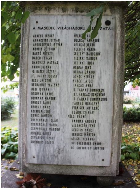
Abb. 6: Denkmal mit den Namen gefallener Soldaten im Ersten Weltkrieg