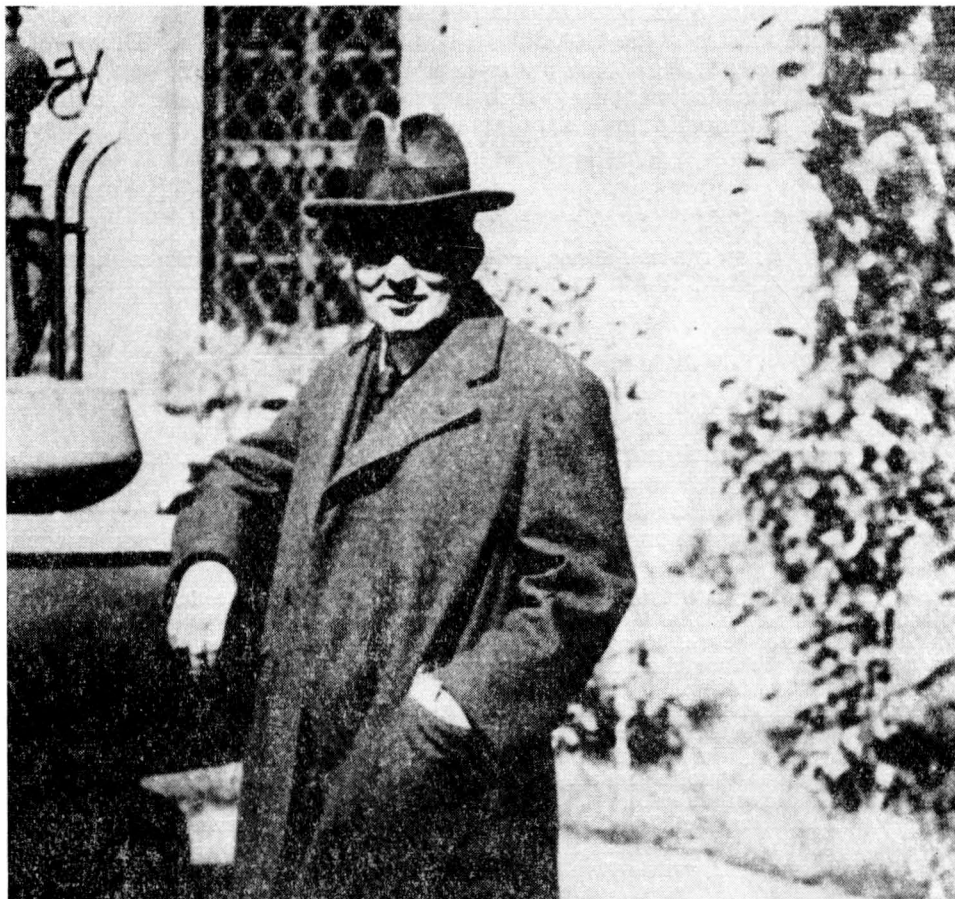
Jiří Karásek ze Lvovic na nádvoří Karáskovy galérie v Praze