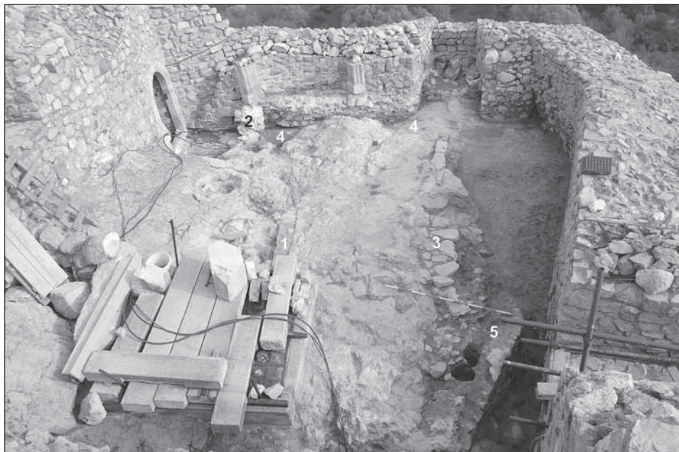
Obr. 4. Stredná terasa. 1 – tehlová dlažba; 2 – maltové murivo; 3 – kamenná dlažba; 4 – žlab; 5 – základy veže.