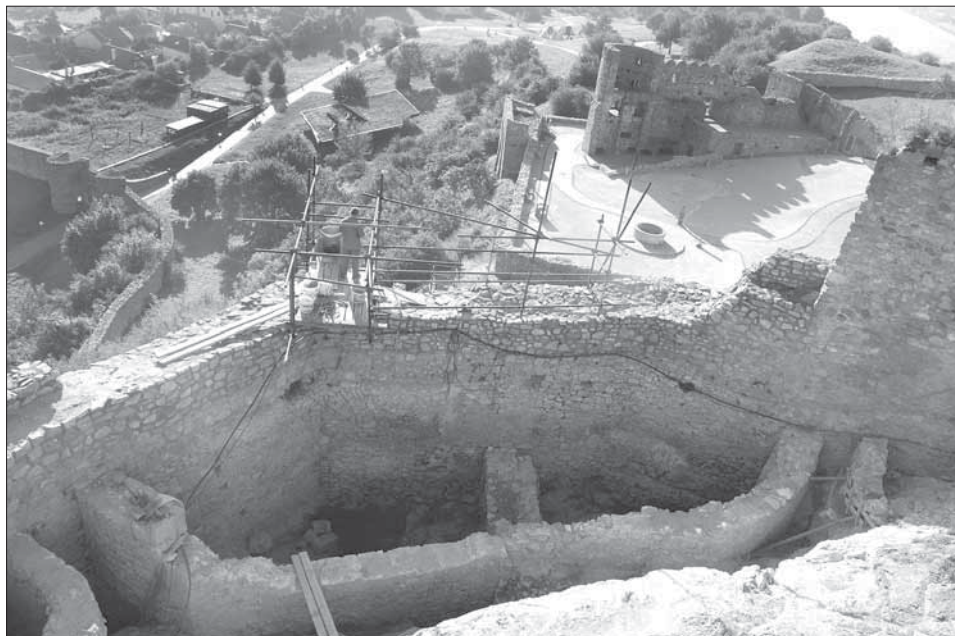
Obr. 1. Dolná terasa horného hradu. Foto K. Harmadyová. Abb. 1. Untere Terrasse der oberen Burg. Foto K. Harmadyová.

Dolnú hranicu výstavby hradby nevieme presne určiť, ale na základe materiálu vo vrstve „O“ máme datovanú jej hornú hranicu do 1. polovice 14. storočia. V tomto období už hradbový múr jednoznačne existoval. Hradba bola postavená priamo na skalu, ktorá sa v priestore skúmanej terasy prudko zvažuje nadol. Skala bola umelo osekaná, v západnej časti sa „lievikovite“ zvažovala k hradbe, vo východnej časti bola menej pravidelne opracovaná, zato tu boli vysekané viaceré stupne pre lepší odtok dažďovej vody. Neboli tu odkryté žiadne sterilné ani antropogénne kultúrne vrstvy, ktoré by sme mohli datovať pred polovicu 14. storočia.