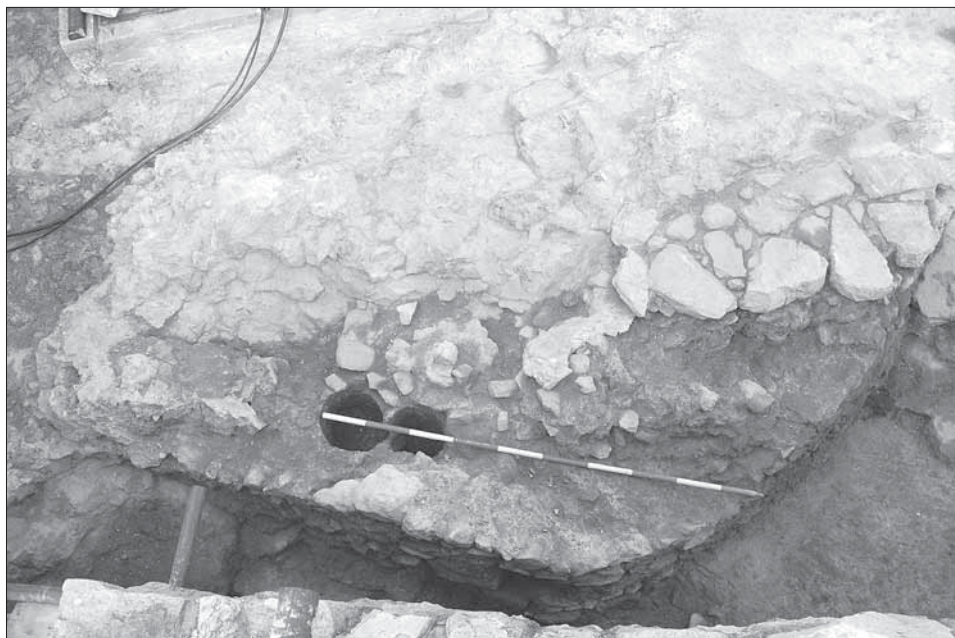
Obr. 5. Základy veže.

Najprekvapujúcejším výsledkom archeologického výskumu v roku 2010 na hornom hrade bolo preto odкрытие zvyškov mohutného lícovaného, mierne zaobleného základového muriva, ktoré nebolo počas starších výskumov zachytené (obr. 5). V kultúrnych vrstvách priliehajúcich k murivu nebola zistená žiadna základová ryha, murivo bolo postavené priamo na skalu, o čom svedčí aj vytečená malta pri základovej škáre priamo na skale. Murivo bolo zachované iba fragmentárne a pripájalo sa na umelo osekanú skalu terasy. Vnútorne líce objektu, ktoré pôvodne vystupovalo nad úroveň skalného podlažia (aj historických dlažieb) je dnes už zničené. Murivo sa zachovalo v maximálnej dĺžke 460 cm a šírke 130 cm. Zaoblenie muriva nebolo pravidelné, v mieste stojacom najbližšie k hradbe vytváralo šikmé zalomenie (brit). Murivo pozostávalo z lomového kameňa, v mieste „britu“ bolo zosilnené