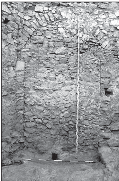
Obr. 2. Sekundárne zamurovaný pôvodný vstup na horný hrad. Foto K. Harmadyová. Abb. 2. Sekundär zugemauerter ursprünglicher Eingang zur oberen Burg. Foto K. Harmadyová.

V priestore terasy bola po osekaní skaly pristavaná k hradbovému múru jednopriestorová prístavba s rozmermi 4,5 × 6 m (obr. 3:2). Do tohto interiéru sa pôvodne vstupovalo pravdepodobne cez 80 cm široký otvor pri hradbe, ktorý bol neskôr zamurovaný (obr. 3:2a). V čase existencie tejto prístavby, ktorá bola postavená pred polovicou 14. storočia, bol stále funkčný poloblúkový vstup v hradbovom múre (obr. 3:1). Murivo tvoriace spolu s hradbou jednopriestorový interiéru bolo kladené na maltu do nepravi-