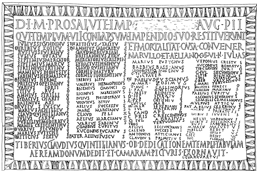
Obr. 1. Album z Viruna – prepis nápisu AE 1994, č. 1334

keré ohledně fungování a sociální struktury tohoto kultu vyvolává, a možné odpovědi, které nastiňuje.