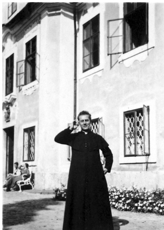
Winter na zámku ve Svojkově (2. polovina 20. let)

Ideový vliv Staffelsteinu vyvrcholil ve třicátých letech, kdy jeho členové převzali vydávání původně říšskoněmeckého časopisu Stimmen der Jugend a šest let se jej snažili prosadit jako orgán mladé generace německých katolíků ze zemí mimo hranice německého státu. Časopis pod jejich vedením programově přinášel texty s „celoněmeckou“ tematikou od autorů z „německého jihovýchodu“, tedy především z Rakouska a Československa. Od roku 1936 vycházel pod změněným názvem Volk und Glaube , který lépe vystihoval základní ideový princip hnutí. Tento princip vedl členy svazu k hledání cest ke sblížení názorových skupin německonárodního, měšťanského a nemarxistického zaměření a pozvolnému budování „sudetoněmecké jednoty“. Od samých počátků tuto jednotu popisovali v pojmech utváření jednotného „národního společenství“ ( Volksgemeinschaft ). Katolická akce se svou myšlenkou farní mládeže sdružující mladé katolíky bez ohledu na příslušnost ke stavu, třídě nebo politické straně byla dlouho myšlena jako první její zárodek.