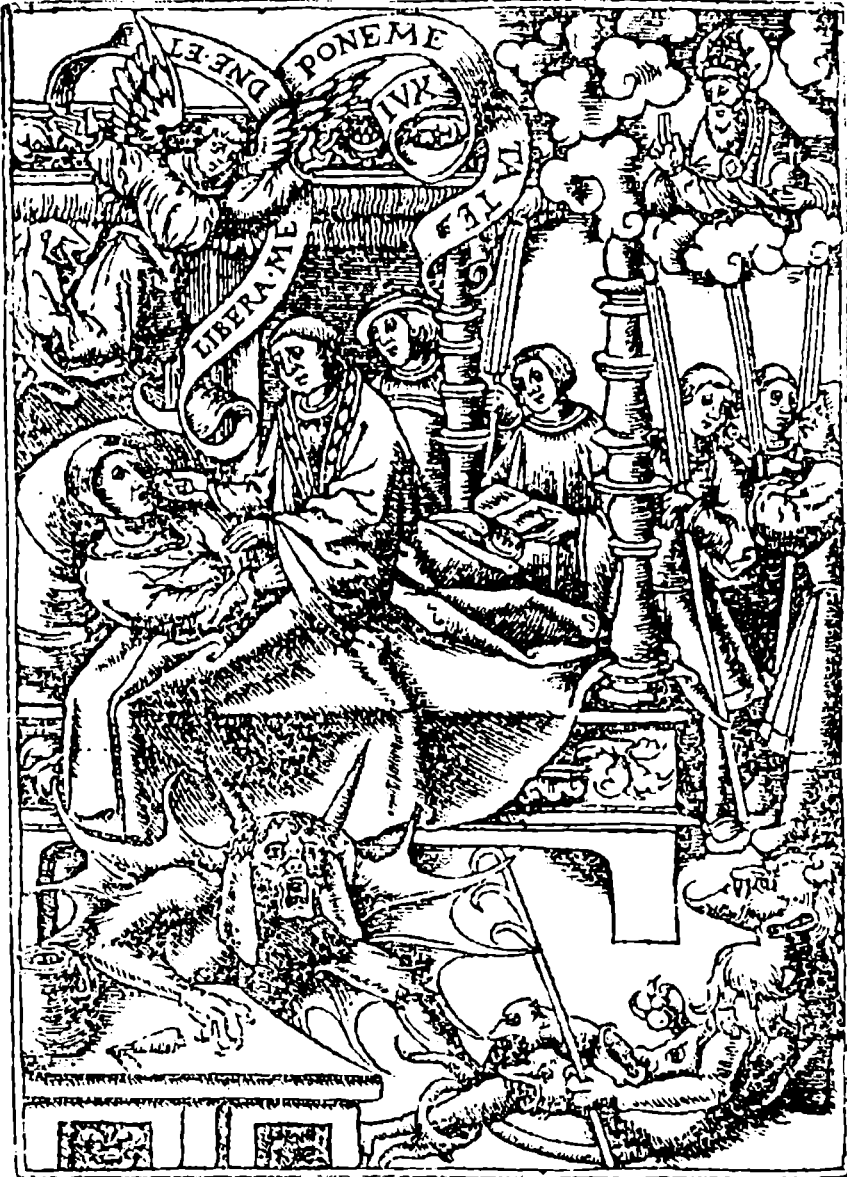
1. Svatá zpověď, přijímání a poslední pomazání podle modlitební knihy F. Regnaulta: Osvobod mne, Pane, a přitáhni mne k sobě.