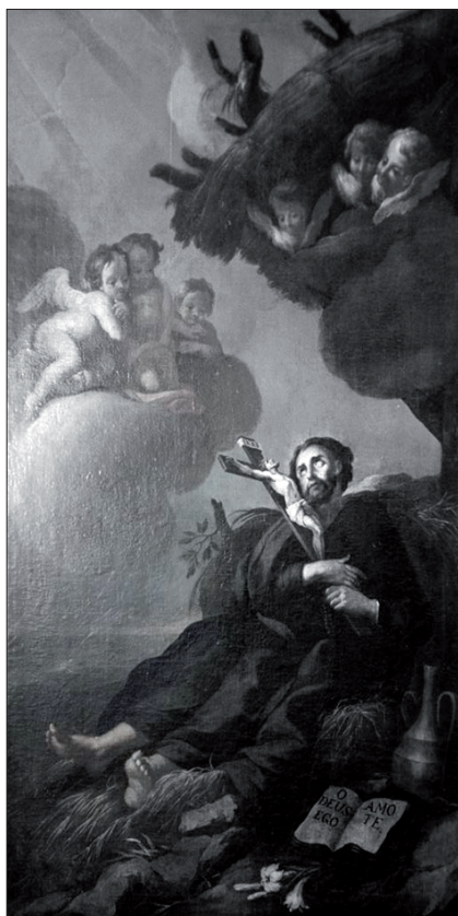
8. Karl Josef Aigen, Smrt sv. Františka Xaverského. Náměšť nad Oslavou, původně farní kostel sv. Jana Křtitele, dnes špitální kaple sv. Anny