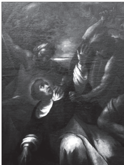
3. Karl Josef Aigen, Martyrium sv. Petra Veronského, detail. Brno, dominikánský kostel sv. Michala