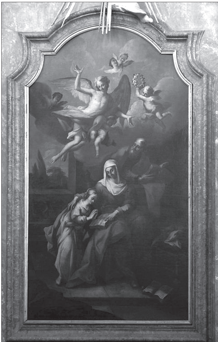
5. Karl Josef Aigen, Sv. Anna vyučující Pannu Marii. Náměšť nad Oslavou, špitální kaple sv. Anny