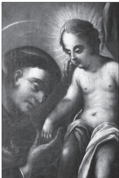
7. Karl Josef Aigen, Sv. Antonín Paduánský s Ježíškem, detail. Náměšť nad Oslavou, farní kostel sv. Jana Křtitele