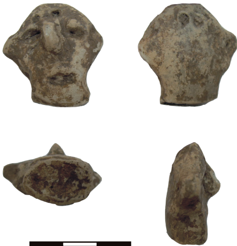
Obr. 3. Brodek u Prostějova – „Hůrka“. Fragment antropomorfní plastiky LnK.