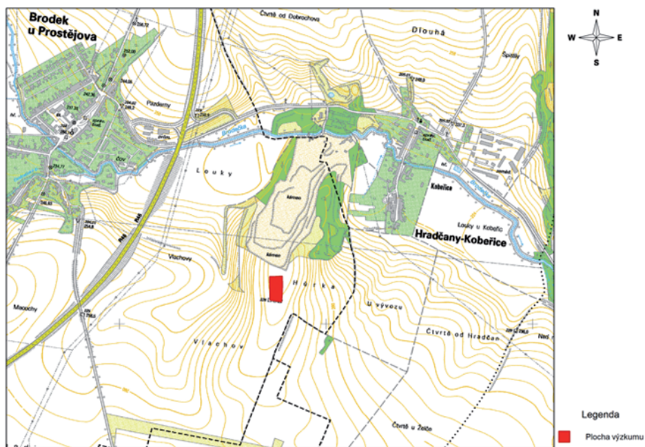
Obr. 1. Brodek u Prostějova – „Hůrka“. Poloha lokality (podle P. Dreslera).

V roce 2005 byl pod vedením T. Berkovce z Archeologického centra Olomouc proveden záchranný archeologický výzkum v Brodce u Prostějova, v trati „Hůrka“ (obr. 1). V jednom ze sídlištních objektů patřících kultuře s lineární keramikou (LnK) byl nalezen fragment antropomorfní plastiky (obr. 2, 3). V článku se budu zabývat tímto konkrétním nálezem, pokusím se jej srovnat s podobnými plastikami nejen ze střední Evropy a zjistit tak možný původ brodecké plastiky.