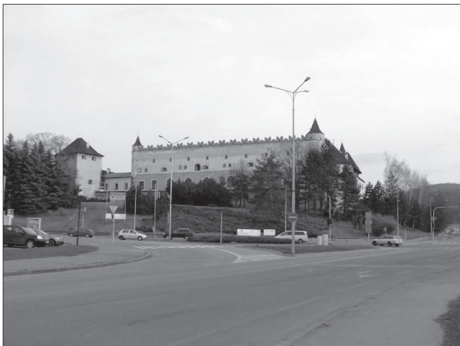
Obr. 1. Pohľad na zámocké návršie od severu.

Praveké osídlenie zámockej vyvýšeniny je známe až z 2. polovice 20. storočia, keď pri obnove Zvolenského zámku v rokoch 1966–1968 v priestoroch centrálného nádvorja, plôch medzi gotickým zámkom a mladším obvodovým opevnením ako i severného svahu prebiehal zisťovací výskum pod vedením Š. Schönweitzovej (1972). Výskum sa uskutočnil počas pokročilých stavebno-konzervačných prác,