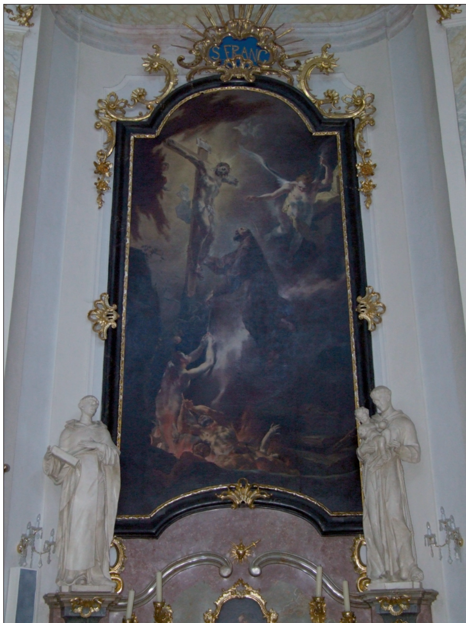
13. Caspar Franz Sambach, Sv. František Serafinský, 1754. Sloup v Moravském krasu, farní kostel Bolestné Panny Marie