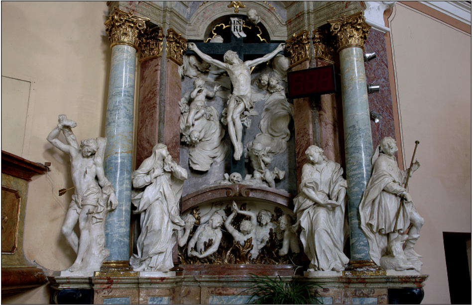
5. Ignác Lengelacher, Oltář sv. Kříže, kolem 1743. Hevlín, farní kostel Nanebevzetí Panny Marie