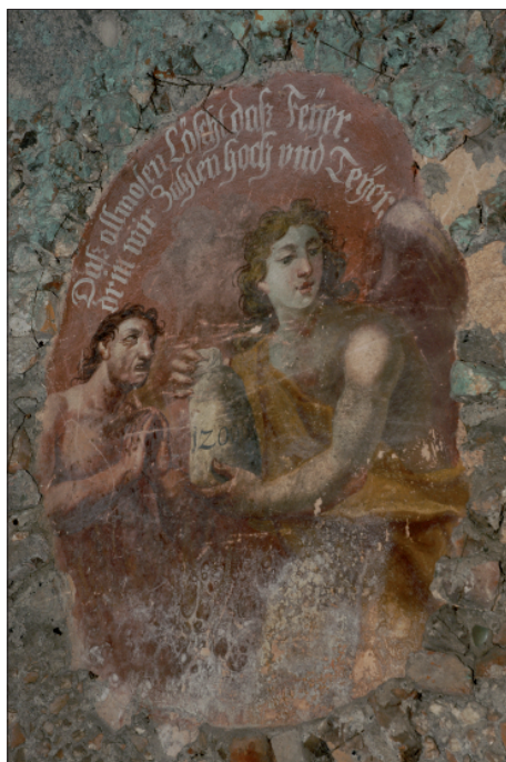
9.–12. Neznámý autor, Duše v očistci a andělé s prostředky pomoci duším (růženec, eucharistie, almužna), kolem 1730. Křenov, farní kostel sv. Jana Křtitele, dušičková kaple