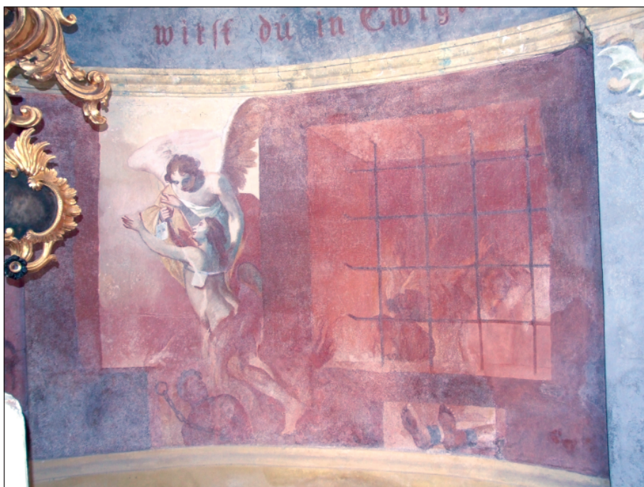
7–8. Judo Tadeáš Supper, Malířská výzdoba hřbitovní kaple Panny Marie Ochránitelky, 1765. Tatenice. Detaily s výjevy očistce na stěnách presbytáře.