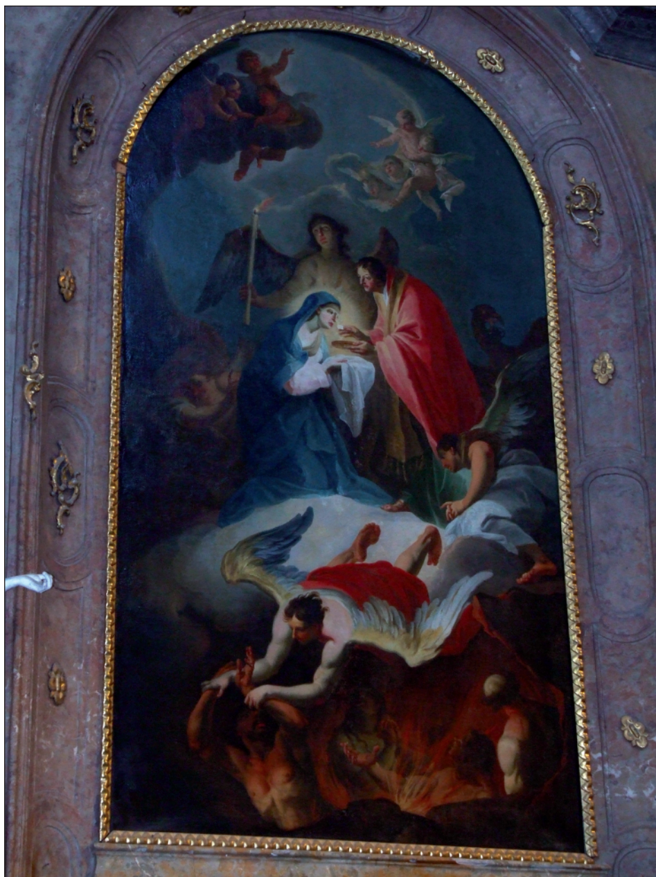
1. Josef Stern, Přijímání Panny Marie, 1757. Drnholec, farní kostel Nejsvětější Trojice