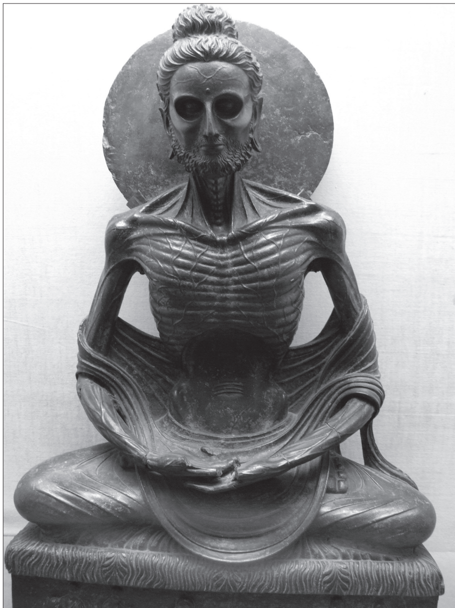
Obr. 2. Jedno z nejslavnějších dochovaných zobrazení Buddhy v podobě tzv. „postícího se asketického Siddhárthy Gautamy“ v tzv. gandhárském sochařském stylu (břidlice či jílovitá břidlicovitá metamorfovaná hornina zvaná fylit, výška 83 cm, cca z 2.–3. století, původem ze Sikri, Severozápadní pohraniční provincie v Pákistánu). (Lahore Museum, Paňdžáb, Pákistán, 4. 6. 2008).