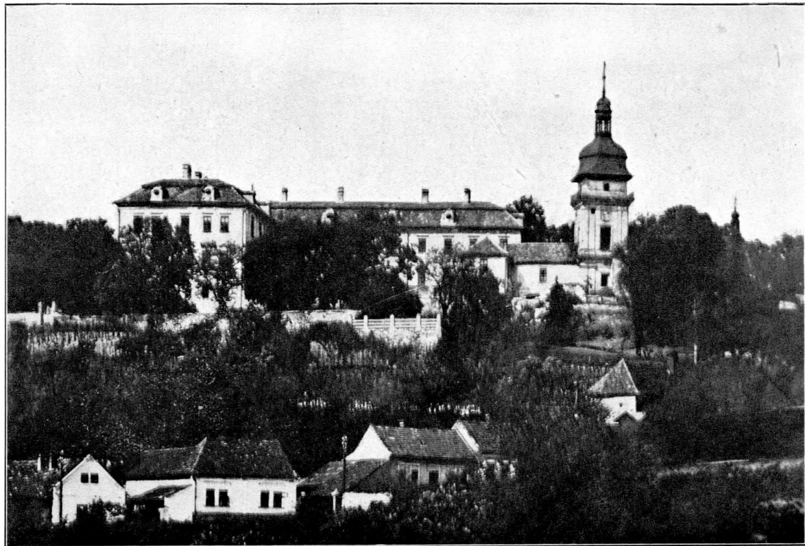
Zámek v Nov. Benátkách v nynější podobě.