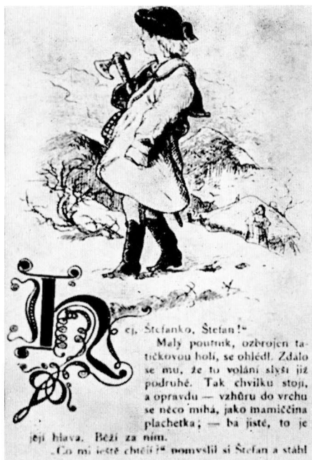
48. Počátek povídky Gabriely Preissové Ovečka s kresbou M. Alše