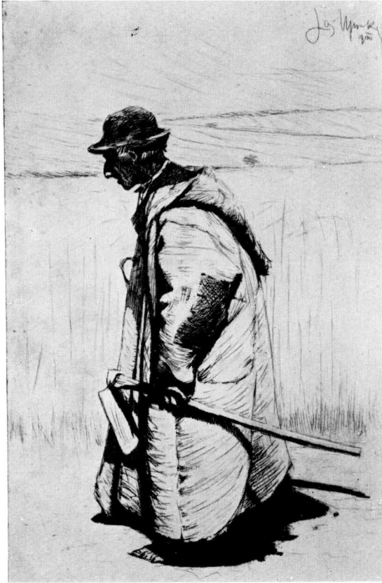
31. József Úprka: Na pole