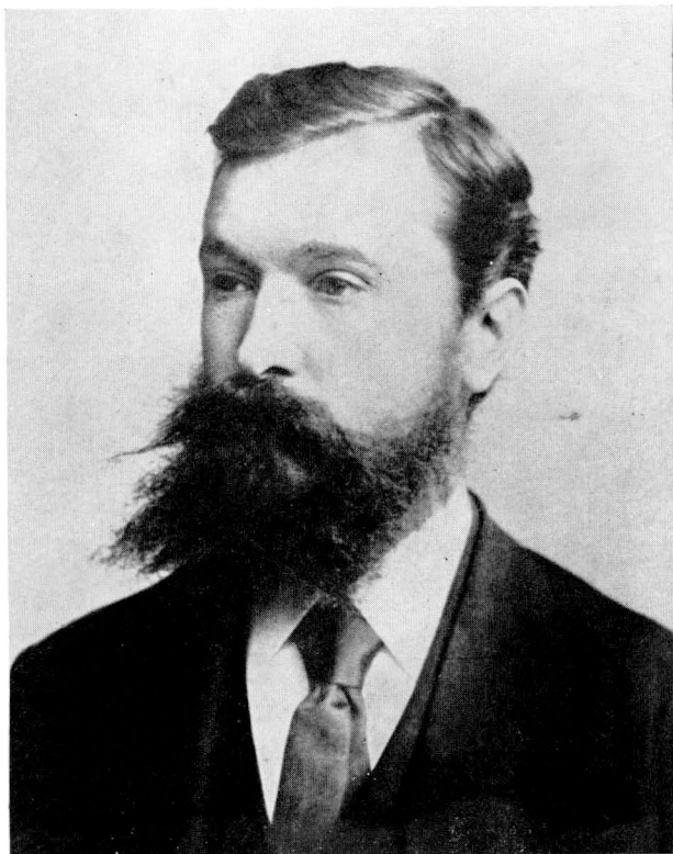
46. Svetozár Hurban Vajanský v mladších letech