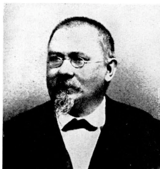
37. Vojta Náprstek