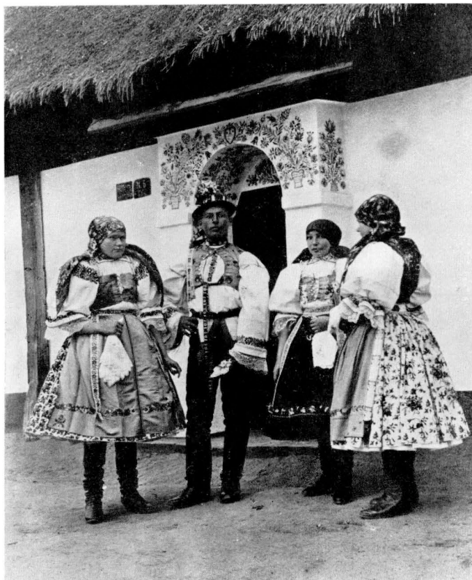
27. Děvčata a šohaj z Rohatce u Hodonína ve svátečních krojích