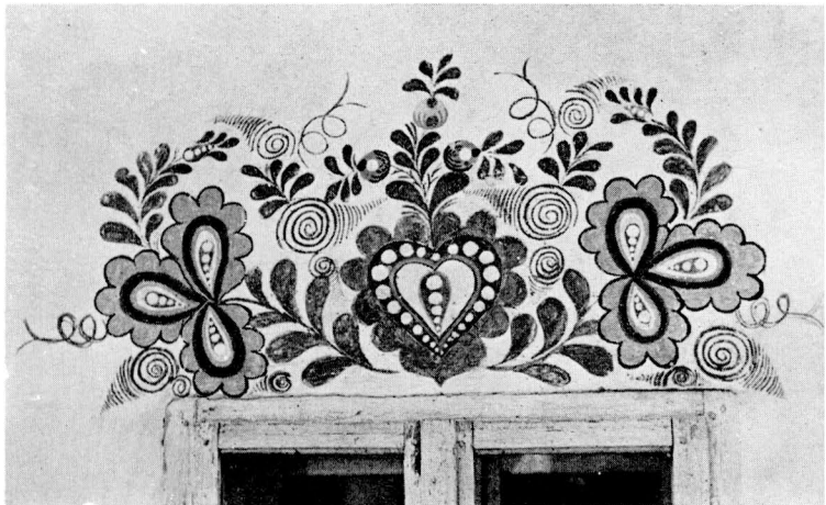
30. Lidová malba nad oknem (Starý Podvorov u Hodonína)