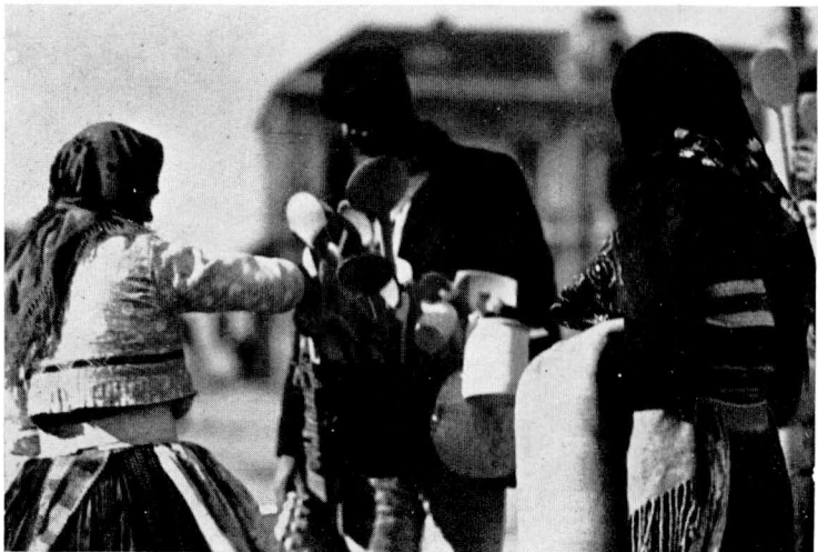
32. Vařečkář a ženy v polosvátečních krojích na jarmarku v Uherském Hradišti