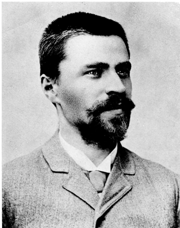
44. Martin Kukučín v letech osmdesátých