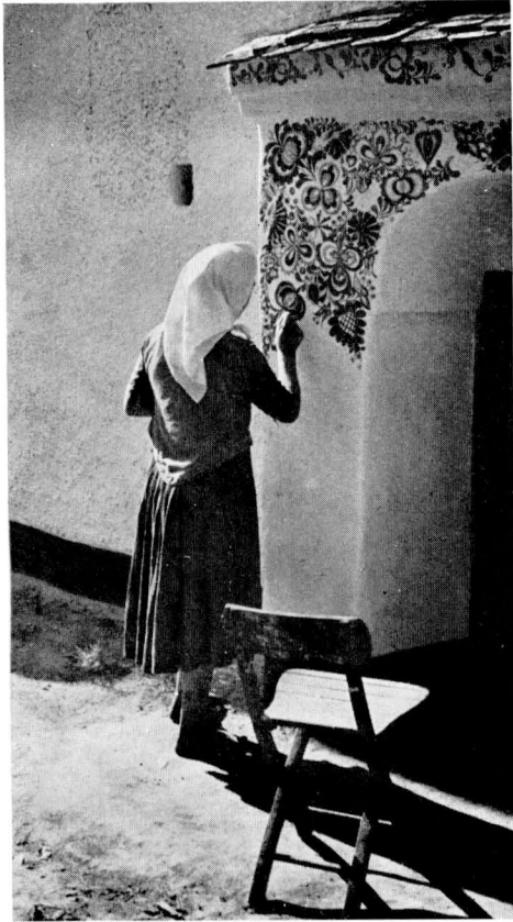
29. Maléřka z Dolních Bojanovic u Hodonína maluje žudro