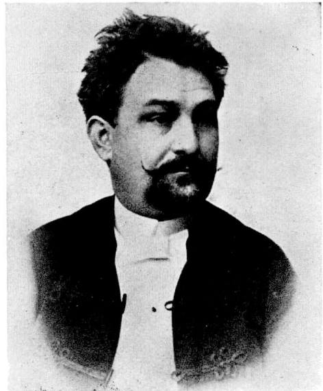
40. Leoš Janáček v letech osmdesátých