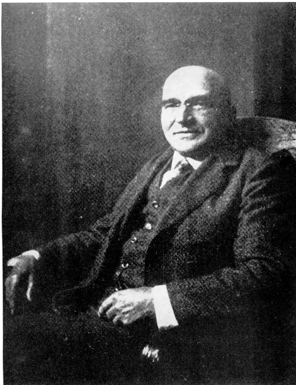
Fotografie Františka Táborského z r. 1928