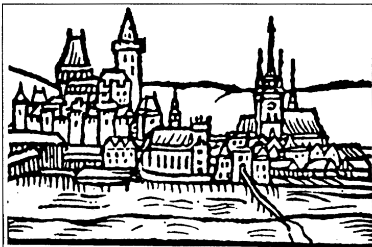
Veduta Přerova od Jana Willingera (z knihy Bartoloměje Paprockého Zrcadlo slavného Markrabství moravského)

Mladý Baltazar i Karel st. ze Žerotína samozřejmě dobře věděli, jaké podmínky musí splnit, aby meziříčské dominium získali. Že se bude v první řadě jednat o konverzi ke katolicismu. Zároveň si ovšem byli vědomi, že právě Baltazar ze Žerotína by mohl být v roli nové vrchnosti přijatelný jak pro dosud ne zcela zpacifikované obyvatelstvo, tak i pro císaře a kardinála. Dietrichstein se navíc mohl postavit za kandidaturu Baltazara ze Žerotína právě proto, aby otupil jeho snahu o zisk tylovického panství na úkor kardinálova synovce.