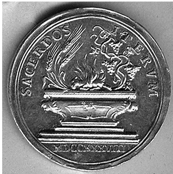
Obr. 4: Mathias Donner, Medaila k príležitosti päťdesiateho výročia kňazstva Imricha Esterházyho, averz a reverz, 1738, Múzeum mincí a medailí Kremnica.

nosti však zrejme bolo átrium, uprostred ktorého sedel arcibiskup s najvzácnejšími hosťami. V príležitostnej scénografickej úprave arcibiskupových záhrad sa už žiadna bohatšia sochárska výzdoba nespomína, a tak pravdepodobným autorom jej konceptu bol zdá sa Antonio Galli Bibiena. V prípade ústrednej časti – átria – išlo zjavne o dosť rozmernú efemérnu, stĺpmi do priestoru otvorenú architektúru, bohato zdobenú malbou a kaširovanými doplnkami, ktorej formu si sčasti možno predstaviť na základe známych analogických, no pre iný účel navrhnutých diel tohto umelca. 30 Keďže šlo už o večernú slávnosť s vrcholom v podobe odovzdania panovníkovho daru o desiatej hodine v noci, je potrebné vo vzťahu k tejto „scéne“, na rozdiel od dennej časti slávnosti konanej v meste a Dóme sv. Martina, predpokladať aj istú formu jej iluminácie. Hoci samotný prameň ju bližšie nemenuje, osvetlenie bolo pri pokročilom čase nepochybne už praktickou nevyhnutnosťou. Navyiac, ako vieme, svetelná réžia, od jednoduchých až po spektakulárne podoby, patrila k bežným súčasťam dobo-