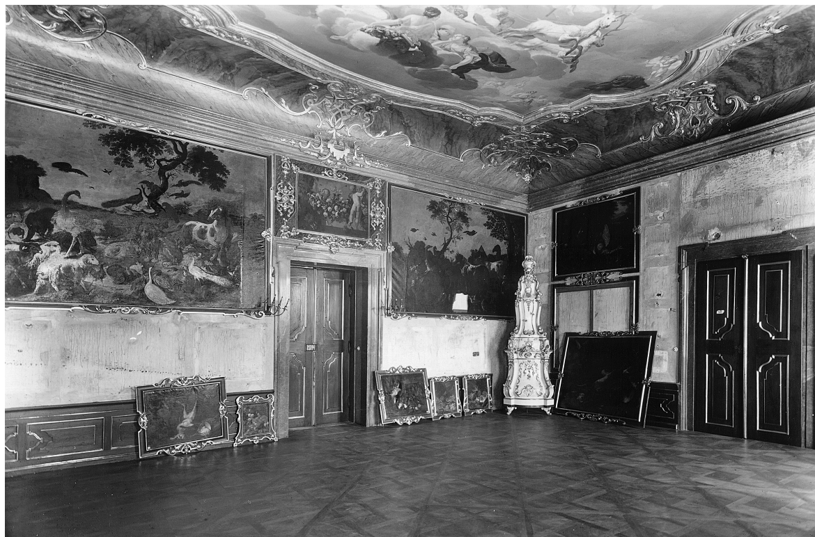
Obr. 4: Valtice, zámek, pohled do obrazárny s loveckými motivy, stav v roce 1959.

ně sedm. Středy východní a severní stěny, které mají po dvou oknech, dnes zabírají velká zrcadla a je možné, že zde tedy obrazy nevisely. Mohlo by to samozřejmě souviset i s nevýhodou instalace obrazů v nepříznivých světelných podmínkách, ovšem v období baroka se s instalacemi obrazů na stěnách mezi okny poměrně běžně setkáváme. Bohužel historické fotografie těchto stran neexistují, takže to nelze ani potvrdit, ani vyvrátit. Na fotografii z roku 1949 jsou ještě vidět zbytky potrháné tapety a spodního plátna. Dostáváme se k dalšímu spornému bodu – pokud byly obrazy rozvěšeny bez mezer mezi rámy, jak to známe z některých barokních obrazáren, pak je otázkou, proč by na stěně jako pozadí měly být řekněme brokátové tapety, jejichž cena nebyla nijak zanedbatelná. Bylo by tedy možné, že ve 20. století již zde obrazy v tak masivním počtu nevisely a rošt, odkrytý pováleč-