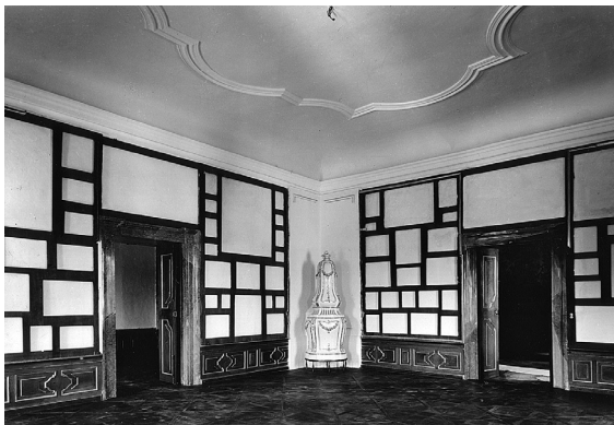
Obr. 3: Valtice, zámek, pohled do bývalé obrazárny, stav po částečné rekonstrukci v roce 1959.

story zasazovány v celku zámecké či palácové dispoziční typologie.