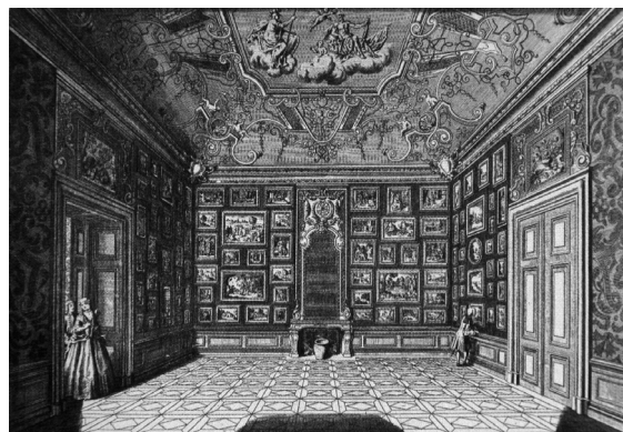
Obr. 6: Vídeň, Horní Belveder, pohled do kabinetní obrazárny.

Není smyslem těchto řádek pouštět se do spekulací, kdy obrazárna vznikla, protože podobné kompozice se vyskytují v evropských interiérech poměrně velmi dlouhou dobu. Právě tak by bylo unáhlené jen na základě poměrně přesného přehledu velikostí obrazů spekulovat např. o tématech či žánrech. S poměrnou jistotou lze přitom vyloučit, že by šlo o grafickou sbírku – na to jsou středové kusy příliš velké. Lze ovšem spekulovat přinejmenším v rámci jednoho objektu – z jiné fotografie pořízené také v roce 1949 je vidět stav lovecké obrazárny v západním křídle. Tam se obrazy vše-