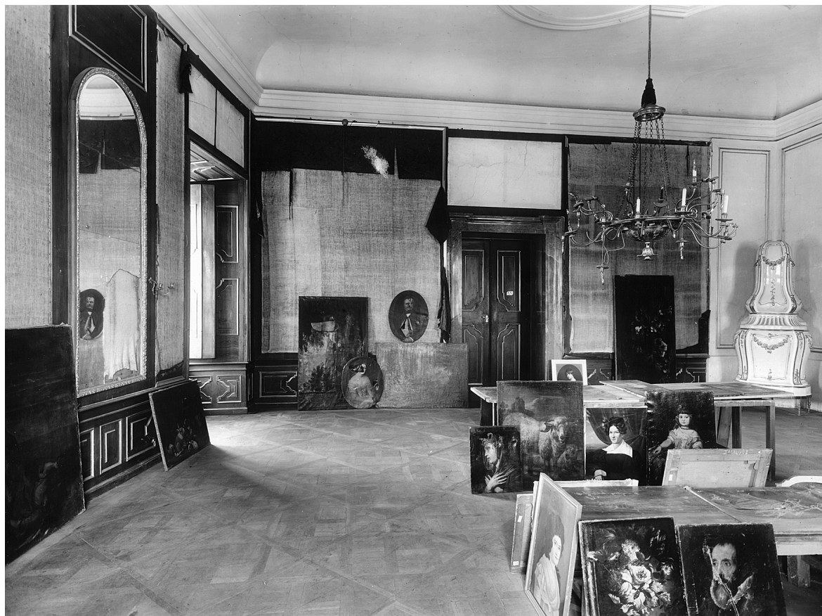
Obr. 2: Valtice, zámek, pohled do bývalé obrazárny, stav v roce 1949.

to chvíli nejde o badatelský problém, kdy toto apartmá vzniklo, ale o to, že analýza funkční náplně interiérů patří k základním metodickým požadavkům památkové péče.