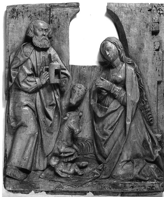
Obr. 5: Mistr Týneckého Zvěstování, Narození Páně, kolem 1500, dřevo, Národní galerie v Praze, zakoupeno ze sbírky Joe Hlouchy v roce 1924.

ní galerie recipročně oněch deset „slovníků“ do Prahy. 113 Deska s Marií Egyptskou (157 × 46,5 cm) tehdy byla zapsána pod inv. č. O 17256, nicméně původní inv. č. O 1363, jakož i OP 1762, zůstalo uchováno na rubové straně. 114 Jak dokládá Hlouchův deníkový záznam datovaný 11. dubna 1923, Marie Egyptská zaujala ředitele Obrazárny Společnosti vlasteneckých přátel umění na první pohled. 115 Kramář se domníval, že dílo by mohlo pocházet z Bratislavy. 116