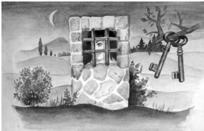
Ztracený klíč , 1972