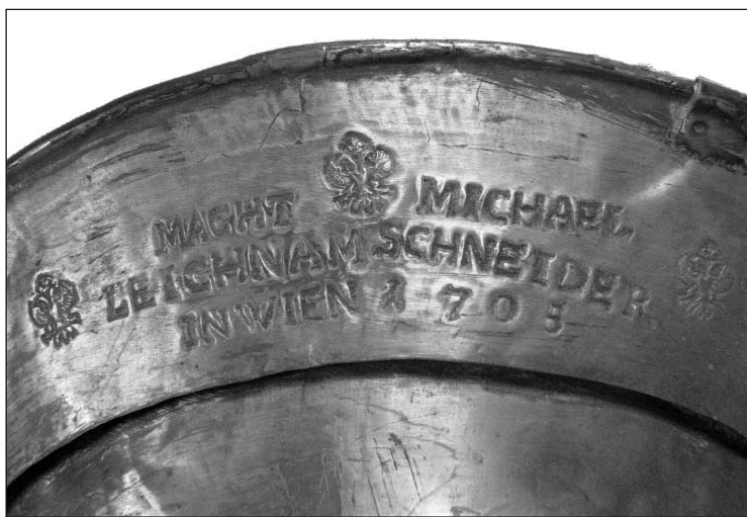
Ab. 2 (Parforcehorn Sign. 77.162)

Ein weiteres interessantes Blasinstrument in den Sammlungen des Museums ist ein Parforcehorn Sign. 77.162 (Ab. 2) aus dem Jahr 1705 aus der Werkstatt des Wiener Instrumentenbauers Michael Leichamschneider (1676–1748). Nach dem Verzeichnis der erhaltenen Instrumente dieses Herstellers im Langwill's In-