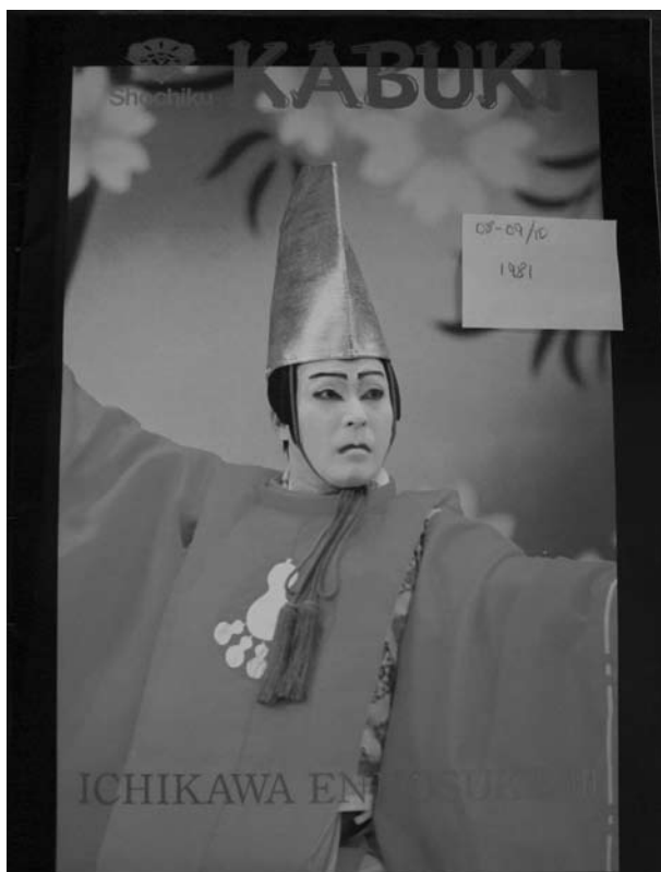
Titulní strana programu k představení kabuki v Paříži roku 1981.

V „západním“, resp. euro-americkém divadle je takový jev sice také možný, ale zároveň jej lze demonstrovat jen na izolovaných příkladech z jednotlivých inscenací. Není tedy na rozdíl od japonského divadla „ukotven“ systémově, ač je jeho potenciální výskyt v kontextu západního divadla možný. Proto je nanejvýš vhodné demonstrovat takový jev na divadelní formě či formách, které jím ve svém systému výrazových prostředků běžně disponují. Divadelní formy, jako je právě např. nó či kabuki, navíc počítají s tím, že po jistém základním obeznámení se s ním je tento systém srozumitelný běžnému divákovi. I model, který nabízí do značné míry stabilní hierarchizace postav v japonském divadle (míním opět hlavně nó, kjógen a kabuki, případně bunraku), je modelem, jenž nemá v současném západním divadle obdoby. Lze říci, že v kontextu západního divadla nenajdeme model dostatečně jednoduchý, dlouholetou tradicí ustálený