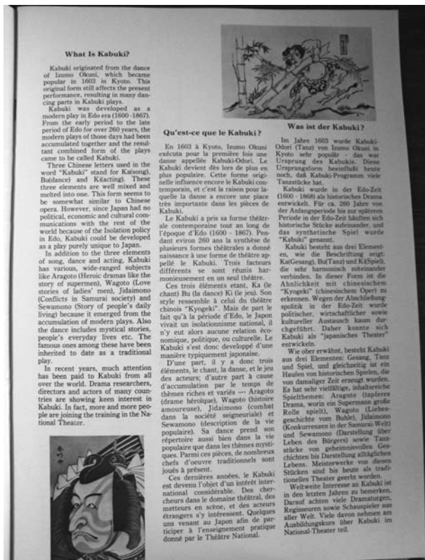
Z programu k představení kabuki v Paříži roku 1981. Na snímku je zachycena stránka podávající základní informace o kabuki.