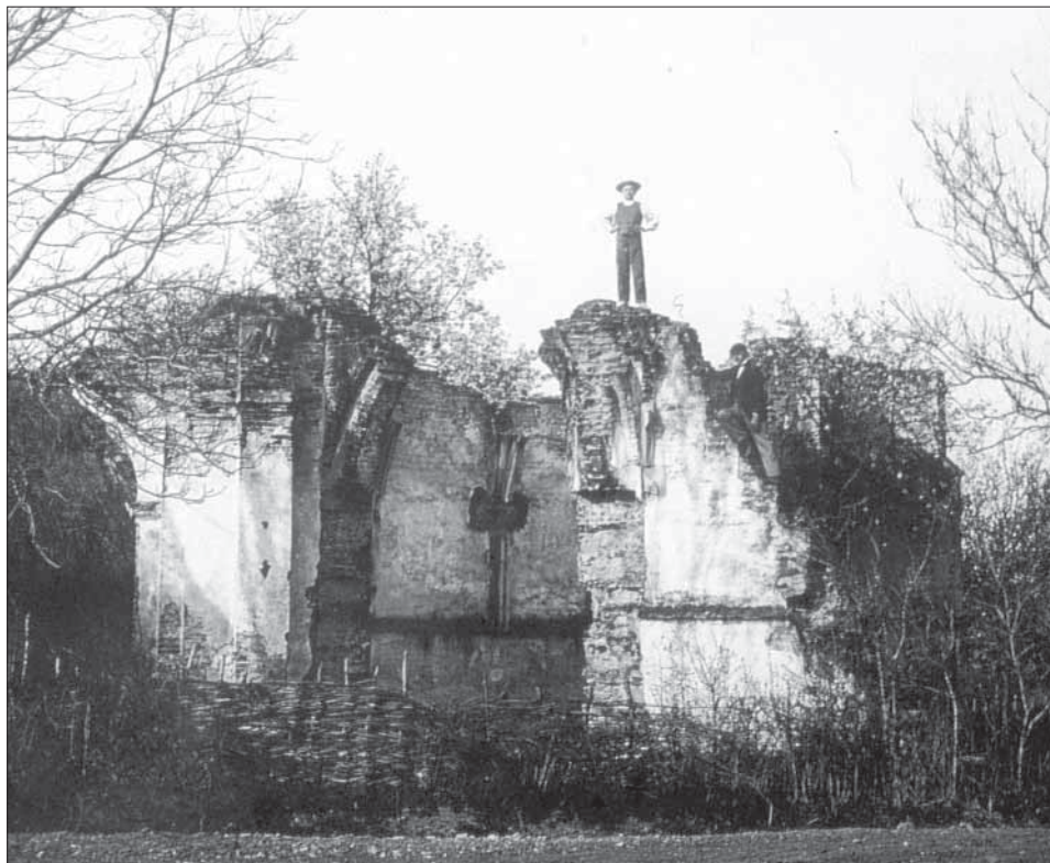
Obr. 3. Ruina stredovekého kostola v Piešťanoch začiatkom 20. storočia.