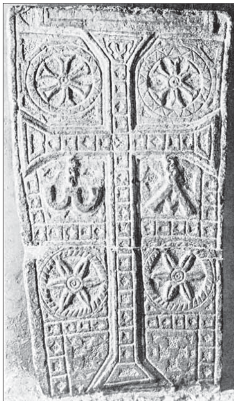
Obr. 4. Sarkofág biskupa Boethia, Venasque. Podľa Février 1985.

Azda najstaršou obmenou podnože kríža bol poloblúk, okrem ktorého k románskym