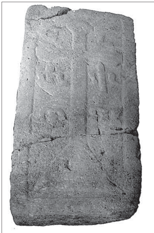
Obr. 2. Náhrobok, Západoslovenské múzeum v Trnave.

Kompozičná schéma, vytvorená v ranom stredoveku, pretrvala pomerne dlho. Zo Slovenska (okrem dosky z trnavského múzea) je známa aj z reliéfnej platne z Bernolákova, ktorá je dnes zamurovaná do východného oporného piliera tamojšieho gotického pres-