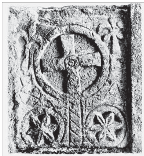
Obr. 5. Reliéf z exteriéru kostola v Bernolákove.

Abb. 4. Sarkophag von Bischof Boethius in Venasque. Nach Février 1985.