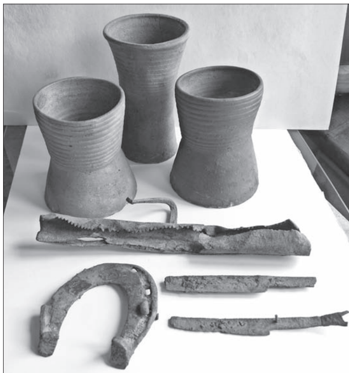
Obr. 11. Košice, Hlavná 96. Výber neskorostredovekých nálezov z výplne obj. 2/11. Abb. 11. Košice, Hlavná-Str. 96. Auswahl spätmittelalterlicher Funde aus der Verfüllung von Objekt 2/11.