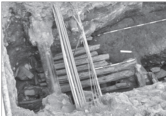
Obr. 4. Košice, Hlavná 96. Pohľad na odkryté brvná prejazdu v reze južne od obj. 2/11. Abb. 4. Košice, Hlavná-Str. 96. Blick auf die freigelegten Balken der Durchfahrt im Schnitt südlich von Objekt 2/11.