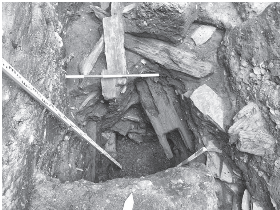
Obr. 9. Košice, Hlavná 96. Časti drevených stavebných konštrukcií vo výplni obj. 2/11.