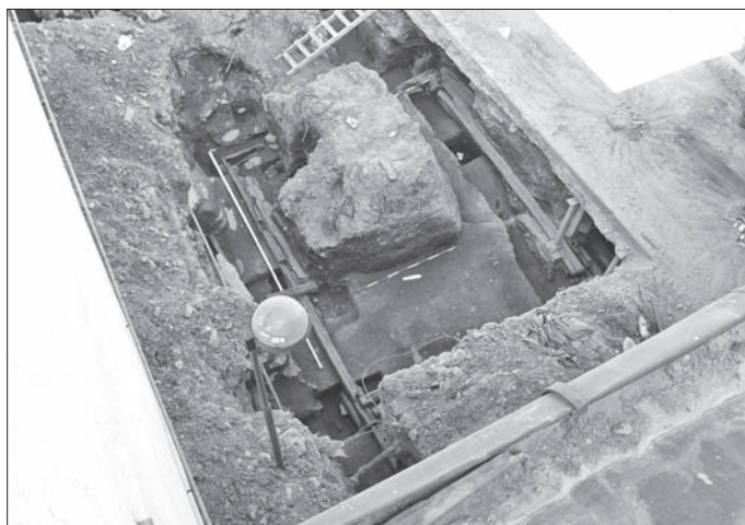
Obr. 3. Košice, Hlavná 96. Celkový pohľad na priestor B objektu 1/11 počas odkrývania. Abb. 3. Košice, Hlavná-Str. 96. Gesamtansicht von Raum B in Objekt 1/11 während der Freilegung.

celý (obj. 1/11/B; obr. 2, 3). Mal rozmery 575 × 515 cm. Ďalšie dva priestory sa podarilo odkryť iba čiastočne. Jeden východne smerom k uličnej čiare (obj. 1/11/A; obr. 2), druhý západne do hĺbky parcely (obj. 1/11/C; obr. 2). Z priestoru východne sa zachoval už iba jeden, južný trám rámovej konštrukcie, zvyšok bol odstránený neskoršími stavebnými úpravami v novoveku. Trám sa zachoval v dĺžke 254 cm, v ďalšom úseku 35–70 cm bol zachytený v negatíve. Priestor západne mal pôvodné rozmery pravdepodobne 410 × 515 cm, bol však výrazne narušený tehlovým objektom, pravdepodobne žumpou z obdobia mladšieho novoveku a čiastočne i neskorostredovekou žumpou. Bezpečne sa podarilo identifikovať iba jeho severnú stenu. Východnú stenu musela tvoriť západná stena susedného priestoru 1/11/B. Južnú stenu odstránila stavba novovekej žumpy, no jej možný fragment v mieste predpokladaného juhozápadného rohu priestoru sa podarilo odkryť na hranici s prejazdom. Žiadne stopy západnej steny sa nezachytili. V tomto priestore sa však odkryl rozsiahly