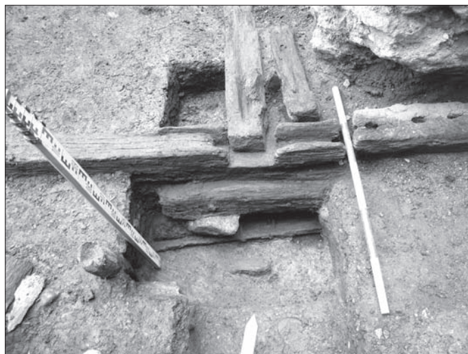
Obr. 6. Košice, Hlavná 96. Obj. 1/11. Nárožie východnej steny priestoru B s južnými stenami priestorov A a B.

západnej steny priestoru B bol vrchný veniec rámu položený ešte na jednom tráme. Situácia pri severnej stene priestoru B bola menej prehľadná. Jej odkrývanie bolo zložitejšie kvôli zhoršeným statickým podmienkam. Severná stena obj. 1/11 totiž celá prebiehala už pod úrovňou súčasnej komunikácie prejazdu domu Hlavná 98 (domy majú spoločný prístup na dvor). Na niekoľkých miestach sa komunikácia podkopala, čo umožnilo odkryť situáciu najmä v rohoch priestoru B, no podkopať komunikáciu prejazdu po celej dĺžke severnej steny obj. 1/11 nebolo možné. V mieste severovýchodného nárožia priestoru B sa komunikácia prejazdu podkopala tunelovým spôsobom až do vzdialenosti 175 cm od jej južnej hrany. Pri tomto odkryve sa na krátkych úsekoch podarilo zachytiť dva trámy, ktoré už priestorovo náležia parcele Hlavnej 98. Situáciu nebolo možné skúmať vo väčšom rozsahu, no poskytla nám doklad o tom, že relikty stredovekej drevenej zástavby sú i na susednej parcele.