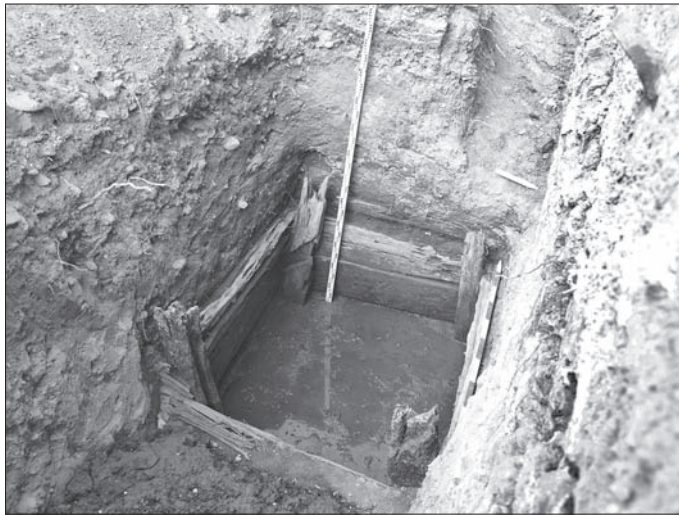
Obr. 5. Košice, Hlavná 96. Obj. 3/11 od severovýchodu.

jamový objekt, žumpa z obdobia neskorého stredoveku (obj. 2/11; obr. 2). Viacero veľkých fragmentov drevených stavebných konštrukcií v sekundárnych polohách z jej výplne je, zdá sa, dokladom väčších funkčných zmien v strednej časti parcely už počas stredoveku. I objekt žumpy však rešpektoval prejazd. Práve južne od obj. 2/11 sa situácia v prejazde odkryla na najväčšej ploche (obr. 4). V severnom profile výkopu bolo viditeľných viacero náznakov, že relikty drevenej zástavby, aj keď už v deštruovanej forme, pokračujú i západným smerom. Výkop však už nebolo možné rozšíriť. Vo vzdialenosti 355–685 cm bola realizovaná ešte jedna menšia sonda, ktorou sa zachytil obj. 3/11 (obr. 5). Kvadratický objekt, tvorený kolovou konštrukciou v rohoch so stenami z dosák, prípadne tenkých, neopracovaných kmeňov uložených za stĺpy na stenu výkopu, pravdepodobne slúžil hospodárskym účelom ako kompostovisko, resp. dodatočne ako odpadová jama. Objekt s rozmermi 205 × 178 cm je mladší, pochádza pravdepodobne až z obdobia mladšieho novoveku. Na jeho stavbu však boli sekundárne využité drevené stavebné konštrukcie, ktoré pravdepodobne pochádzajú z obj. 1/11.