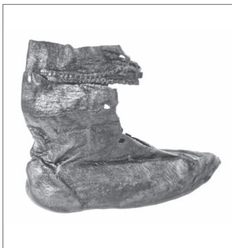
Obr. 10. Košice, Hlavná 96. Zachovaný exemplár koženej obuvi z výplne obj. 2/11.