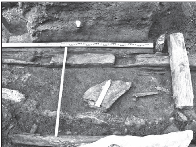
Obr. 7. Košice, Hlavná 96. Rám južnej steny priestoru B obj. 1/11 s lôžkami pre stĺpcovú konštrukciu steny.

Abb. 7. Košice, Hlavná-Str. 96. Rahmen der Südwand von Raum B von Objekt 1/11 mit Ausklüngen für die Stützbalkenkonstruktion der Wand.