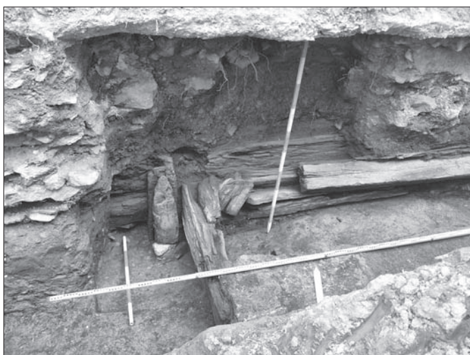
Obr. 8. Košice, Hlavná 96. Rozhranie severozápadného rohu priestoru B a časť severnej steny priestoru C obj. 1/11. Pohľad z juhu.

Abb. 7. Košice, Hlavná-Str. 96. Rahmen der Südwand von Raum B von Objekt 1/11 mit Ausklüngen für die Stützbalkenkonstruktion der Wand.