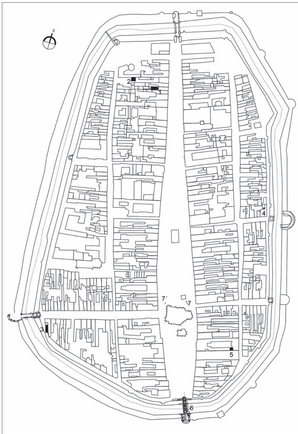
Obr. 1. Košice. Nálezy drevených stavebných konštrukcií z obdobia stredoveku v historickom jadre mesta. 1 – Hlavná 96; 2 – Mäsiarska 57/A; 3 – Alžbetina 36; 4 – Pri Miklušovej väznici 10; 5 – Hlavná 27; 6 – Dolná brána; 7 – Hlavná ul., nám. severne od Dómu.