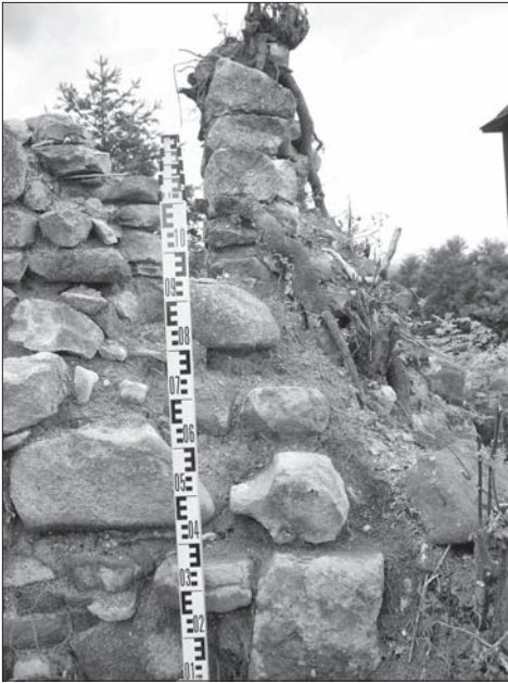
Obr. 6. Detail juhovýchodného nárožia presbytéria v exteriéri so sekundárne použitým klenbovým rebrom. Abb. 6. Außendetail der südöstlichen Ecke des Altarraums mit sekundär verwendeter Gewölberippe.