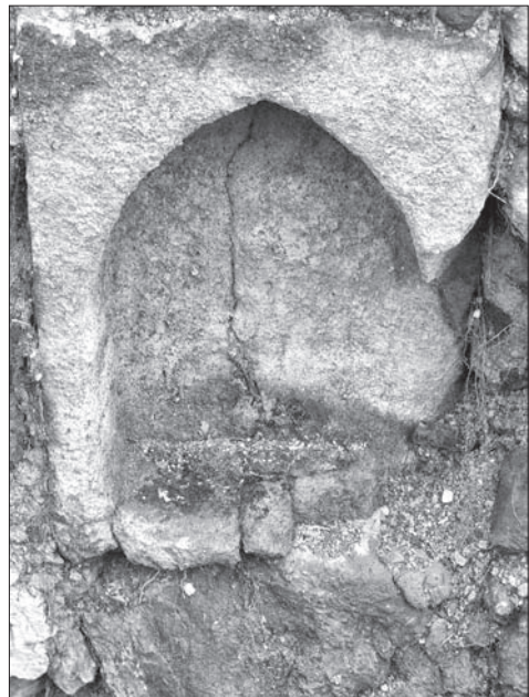
Obr. 8. Detail niky v južnej stene presbytéria. Abb. 8. Detail der Nische in der Südwand des Altarraums.

Datovať kostol archeologickými metódami nie je na základe súčasného rozsahu výskumu možné. Na základe analógií pôdorysu a rebier klenby by mohol kostolík chronologicky súvisieť s výstavbou okolitých ranogotických sakrálnych stavieb, a to Kostola sv. Michala archanjela v Hornej Mičinej, datovanej do druhej polovice 13. storočia (Súpis 1968, 502), ale najmä Kostola sv. Michala v Čeríne a Kostola svätého Františka Se-