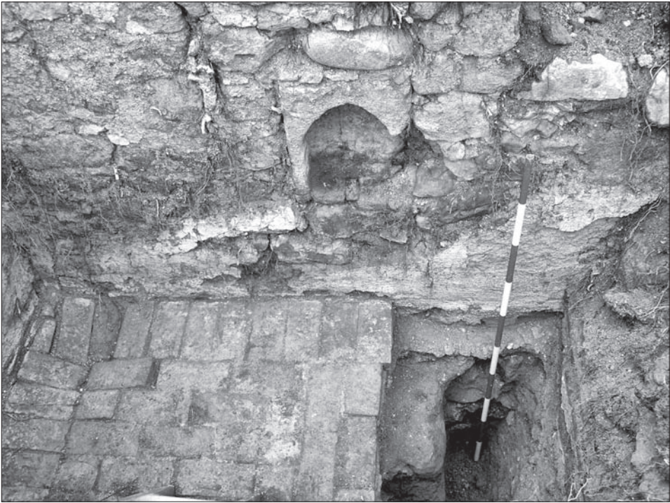
Obr. 2. Pohľad na zachované murivo južnej obvodovej steny presbytéria a novovekú tehlovú dlažbu.