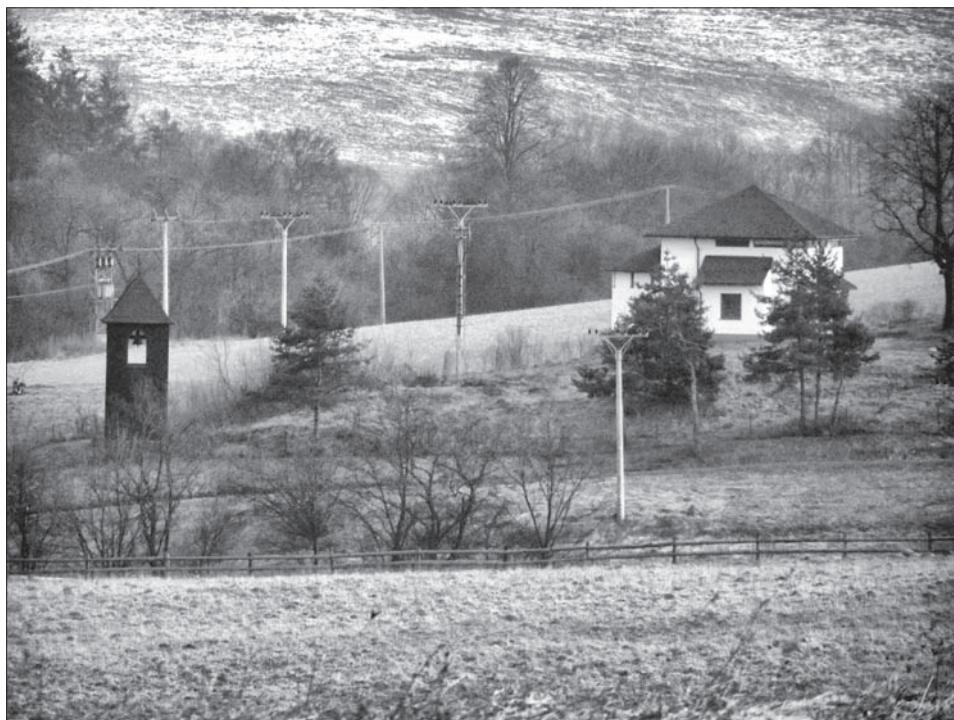
Obr. 1. Poloha zaniknutého kostolíka na miernom návrší vpravo od drevenej zvoničky.