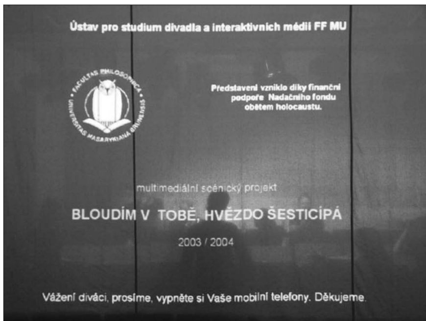
Obr. 1. Fotografie z představení Bloudím v tobě, hvězdo šesticipá