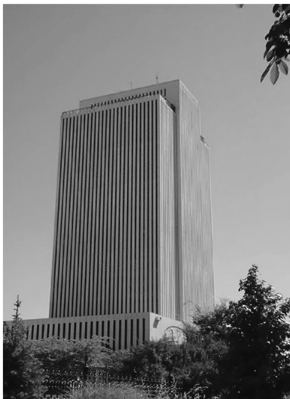
Obr. č. 11: Voluntarismus má za následek schopnost velké akumulace prostředků a energie – Administrativní ústředí LDS (mormonů), Salt Lake City (UT).

Druhým významným důsledkem voluntarismu je dobrovolná participace na činnosti a životě náboženské skupiny. Tato participace přitom nabývá velmi širokého spektra podob – počínaje pravidelnou finanční podporou, která je v USA nejvyšší ze všech vyspělých zemí, a konče dobrovolnickou prací v různých aktivitách spojených s činností dané náboženské skupiny. Výsledkem je mimo jiné i schopnost velké kumulace finančních prostředků , stejně jako rozsáhlá sociální činnost značné části náboženských skupin působících ve Spojených státech.