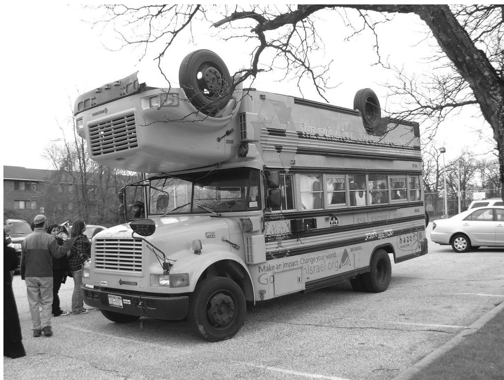
Obr. č. 17: Příklad environmentálního aktivismu i mezi „tradičními“ náboženskými skupinami. Podpora mezinárodního projektu The Jewish Climate Change Campaign hnutím Hazon. Zdroj: The Shoshana S. Cardin School . The Jewish Climate Change Campaign Comes to Cardin. In: Cake on Fridays [online] 30. 9. 2009. [vid. 2013-11-10]. Dostupné z http://cardinschoolblog.blogspot.cz/2009/11/jewish-climate-change-campaign-comes-to.html

Konkrétním projevem jsou pak takové fenomény jako již zmiňovaný televangelismus nebo další způsoby „upoutávání pozornosti“ pomocí šoku, symbolické zkratky či skandálu. Dobrým příkladem bylo mediálně skvěle zvládnuté a připravené vystoupení pastora Terryho Jonese, duchovního malé fundamentalistické skupiny působící na Floridě, který na 11. září 2010 vyhlásil „Mezinárodní den pálení Koránu“. Efekt této provokativní a kontroverzní akce byl mimořádný. Během několika dnů se stal Terry Jones mediální hvězdou a jeho kongregace, mající všeho všudy čtyřicet členů, jednou z nejznámějších ve Spojených státech. 71