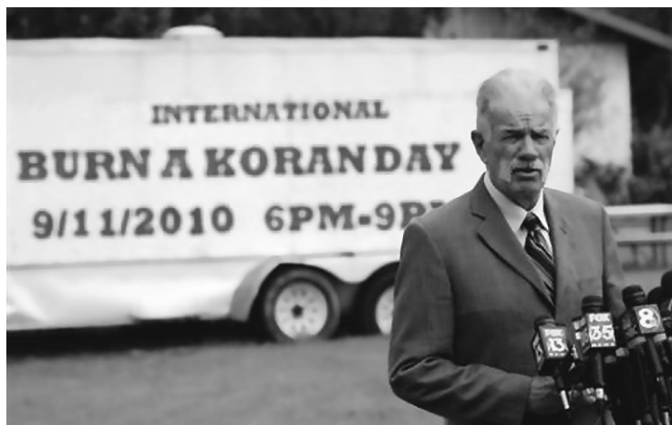
Obr. č. 18: Pastor Terry Jones s reklamou na kampaň vyzývající k pálení Koránu, Florida.

Pragmatismus amerického náboženství se ale neprojevuje jen tímto poněkud kontroverzním způsobem. Za jeho součást či výraz je třeba považovat i takové skutečnosti jako pečlivá volba klíčových témat činnosti (praktické i ideové) konkrétních skupin. V tomto ohledu je tak například zmíněná The Jewis Climate Change Campaign stejně tak projevem náboženského aktivismu , jako výrazem pragmatismu „amerického náboženství“ . Podobných příkladů z dalších oblastí, jako jsou třeba ochrana lidských práv, sociální rovnost či naopak zdůrazňování „tradičních hodnot“ typu individualismu, bychom mohli jmenovat celou řadu.