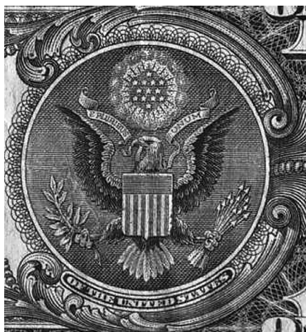
Obr. č. 6: Rub jednodolarové bankovky s tzv. Velkou pečeti Spojených států. Orel drží v zobáku mluvicí pásku s heslem E Pluribus Unum.

V předchozí kapitole jsme se pokusili ukázat základní modely interpretace dějin amerického náboženství. I přes rozdílná východiska a přístupy, která jsou s jednotlivými modely, označovanými jako konsenzuální, konfliktualistické a kombinované paradigma, spojené, se přesto ukázalo jedno téma společné všem těmto přístupům. Tímto tématem a v jistém ohledu můžeme dokonce říci, že i klíčem k pochopení amerického náboženství, je fenomén pluralismu . Nejde však jen o téma či problém výsostně náboženský. Právě naopak. Pluralismus je jedním z ústředních témat i pro americkou kulturu, společnost a politiku. Ba co víc, je nedílnou součástí diskusí týkajících se americké identity, jejího vytváření a transformování. V této souvislosti je možné zmínit oficiální motto Spojených států – E pluribus unum , s nímž je možné se setkat nejen na státním znaku Spojených států, ale také na dalších významných symbolech, např. dolarových bankovkách.