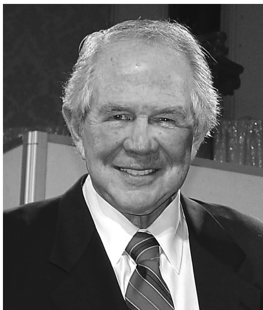
Obr. č. 39: Pat Robertson (nar. 1930).

Volání po obnově původní, křesťanské Ameriky, se kterým se můžeme setkat na začátku nového tisíciletí, vychází v mnoha ohledech z rétoriky a „logiky“ převzaté od Morální většiny či Křesťanské koalice, ale je zároveň doplněno o nové prvky, k nimž patří zejména islamofobie a silné zdůrazňování tradičního amerického individualismu. Z této perspektivy je pak zřejmé, proč je současný americký prezident Barack Obama vnímán některými představiteli ortodoxie jako agent islámu a zároveň jako komunista.