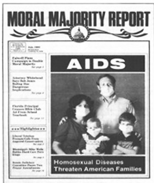
Obr. č. 36: Jedním z velkých „ortodoxních“ témat je podpora tradiční rodiny.

že s podobnými pocity je možné se setkat i v některých kruzích liberálních sekularistů , kteří se chápou rovněž jako osamocení bojovníci s netolerantními a reakcionářskými fundamentalisty, kteří odmítají rovnost pohlaví, svobodu vědeckého bádání, etnickou a náboženskou pluralitu Spojených států a kteří se snaží odstranit 1. dodatek americké ústavy.