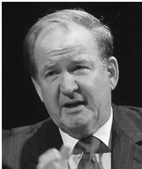
Obr. č. 37: Patrick Buchanan (nar. 1938).