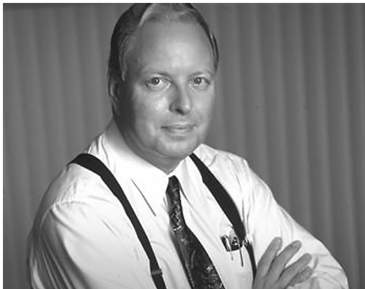
Obr. č. 34: Paul Weyrich (1942–2008), spoluzakladatel Morální většiny. Na rozdíl od většiny jejích aktivistů byl Weyrich katolík. Zdroj: Paul Weyrich dead. In: Watch and download online [online] 20. 12. 2008. [vid. 2013-11-10]. Dostupné z http://timepassonlines0.blogspot.cz/2008/12/conservative-activist-paul-weyrich-dead.html

Tyto kruhy reprezentované skupinami, jako Morální většina , vedená Jerry Falwellem a Paulem Weyrichem (1942–2008), mobilizovaly své členy voláním po duchovní a morální obnově, které jediné byly chápány jako účinné nástroje obnovení americké společnosti a ozdravení americké politiky. Zároveň s sebou přinesly nový postoj a strategii v kritice soudobé sekulární společnosti, která byla založena na „ překonání sektářského rozdělení americké společnosti a zdůrazňování společných morálních principů, které byly v 60. a 70. letech údajně v ohrožení “. 122