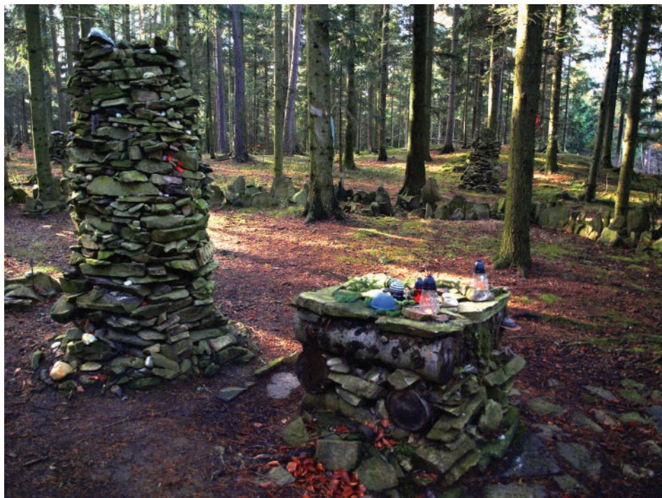
Obr. 3. Obětní oltář a sloup uvnitř kamenného kruhu na lokalitě u Třisova.

Dva soustředné kamenné kruhy, z nichž větší dosahuje průměru cca 12 m, vznikly v roce 2007 na návrší nad obcí Třisov. Vnější kruh má jeden vstup, vnitřní má vstupy čtyři. Cesta vedoucí ke kruhu je rovněž lemována vztyčenými kameny.