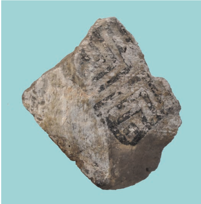
Obr. 2. Janíky - Dolné Janíky, mohyla IV. Súčasný stav zachovania negatívneho odtlačku maľby steny hrovej komory. Šírka artefaktu je 17,9 cm.