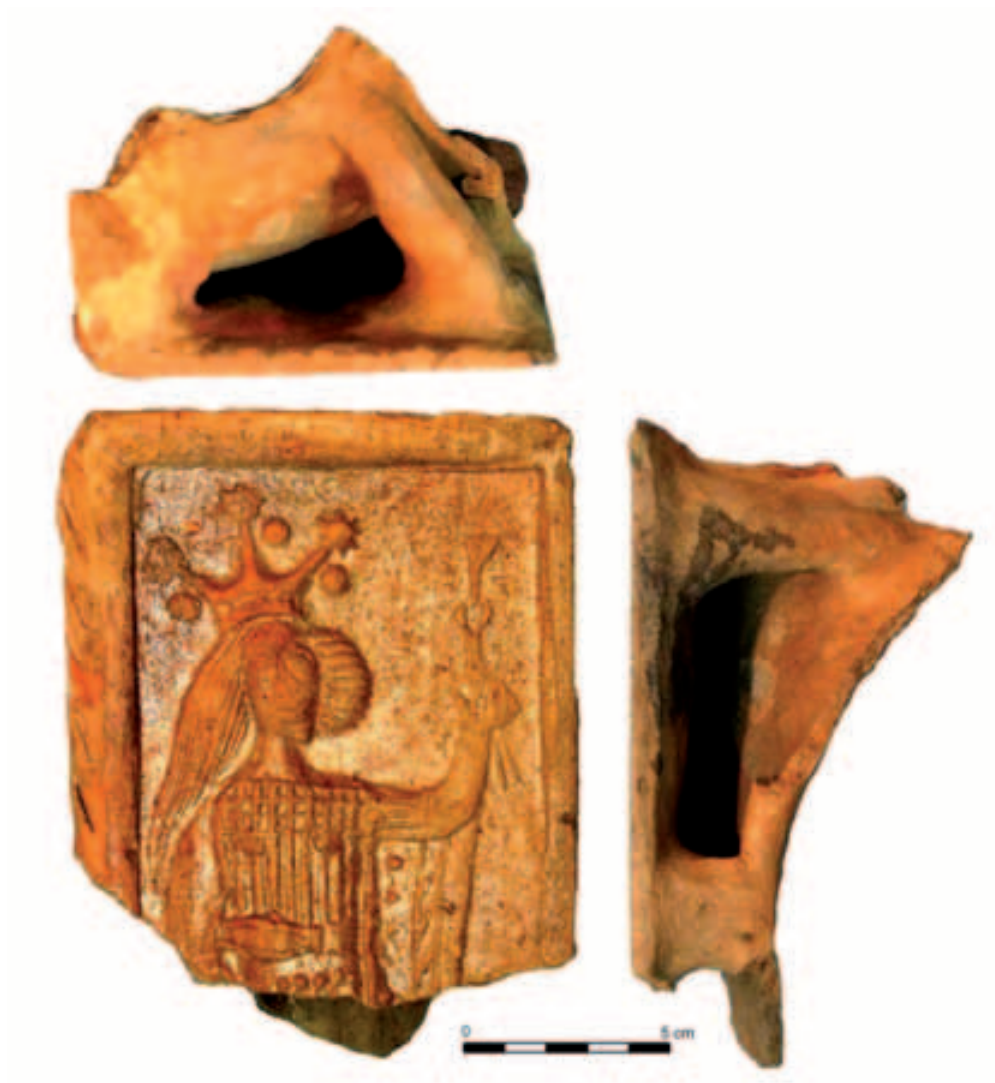
Tab. 2. Kachel se sv. Apolenou, Heraldice, konec 15. století.