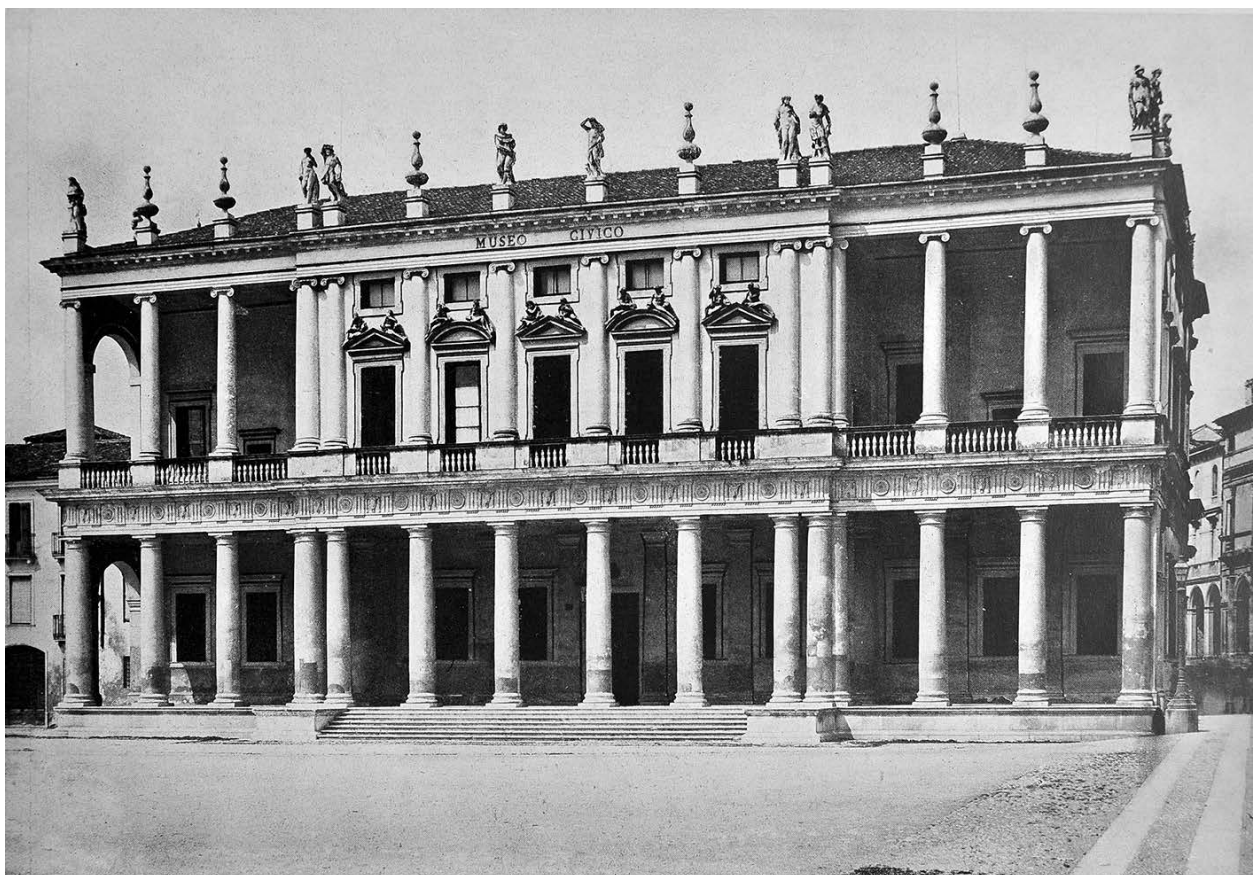
4 – Obrazová příloha s vyobrazením Palladiova Palazzo Chiericati ve Vicenze, in: Vojtěch Birnbaum, Barokní princip v dějinách architektury , Praha 1941

přetváří a narušuje. Tímto narušením však nepopírá dané zákonitosti, pouze je mění do moderní podoby svého „uměleckého chtění“. Zdá se, jako by samotným smyslem tohoto uměleckého chtění byl právě „barokní princip“. 46