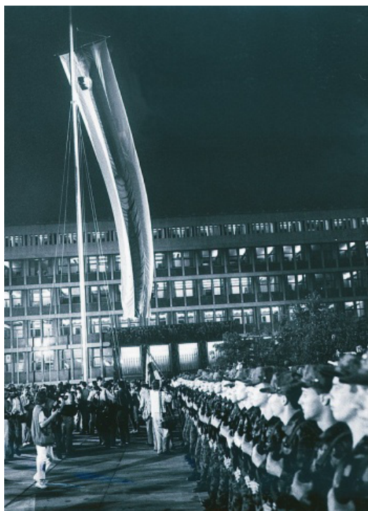
Vyhlášení slovinské nezávislosti 25. 6. 1991

Slovinským a chorvatským představitelům se zřejmě podařilo během roku 1991 získat určitou podporu ve Spolkové republice Německo a v Rakousku. I když představitelé ES Jacques Delors a Jacques Santer během návštěvy Bělehradu 29. a 30. května 1991 opět žádali od Ante Markoviće udržení jednoty Jugoslávie a ačkoliv představitelé ES opakovaně zdůrazňovali, že neuznají nezávislost jednostranně se