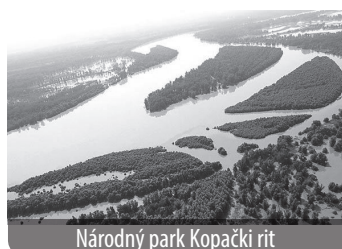
Národný park Kopački rit