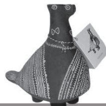
Vučednícká holubica, symbol Slavónie

PANČIČ, K. Kulturno naslijeđe i turizam . Radovi zavoda za znanstveni rad HAZU Varaždin, 2006, br. 16–17, s. 211–236.