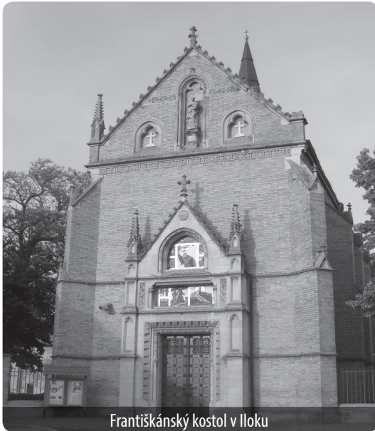
Františkánský kostol v Iloku

ktoré má v tomto regióne dlhú tradíciu. Hlavná časť podujatia začína v prvý septembrový víkend a nadväzuje na starý srijemsko-slavónsky obyčaj jarmokov pri príležitosti vinobrania, ktorý je spätý so stretnutím mladých ľudí, ochutnávkou a predajom vína, poľnohospodárskych produktov. Ústredným mottom týchto slávností je predovšetkým zachovanie tradícií vinárstva, etnológie, ako aj promócia domácich výrobkov Slavónie a Západného Srijema.