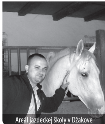
Areál jazdeckej školy v Džakově

„Georeliéf územia sa formoval v dôsledku fluvialných procesov. Dráva a Dunaj tu počas stáročí vytvorili malebné meandre, ostrovy a zátišia v podobe mŕtvych ramien, ktoré miestne obyvateľstvo prezýva „dunavac“ alebo „stará Dráva“ 8 .