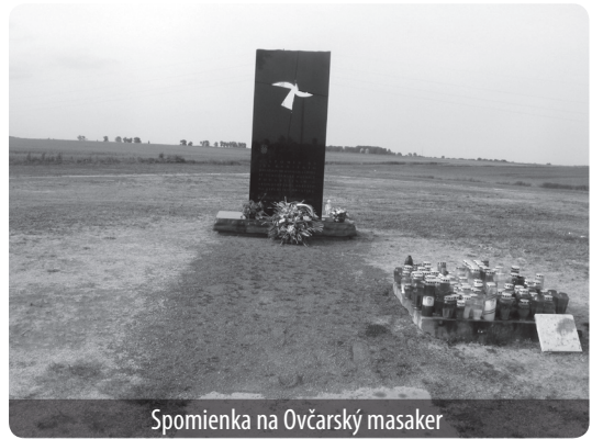
Spomienka na Ovčarský masaker

Ovčara ležiaca približne 10 km juhovýchodne od Vukovaru je od nepamäti známa farma na chov ošípaných, dnes patriaca poľnohospodárskemu družstvu VUPIK. S obcami Grabovo a Jakobovac predstavovala v minulosti obraz feudálnej moci a bohatstva grófskej rodiny Eltz. V roku 1991 sa stala miestom nenávisti, zloby a genocídy, na ktorom boli zabití civilisti a medicínski