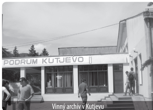
Vinný archív v Kutjevu

S Kutjevom, ako aj s jeho vinným archívom, je spojených niekoľko legiend. Jedna z nich hovorí, že významný barón Franjo Trenk vybudoval pod celým mestom katakomby, v ktorých skladoval vína. Po skončení vojenských výprav smerovala jeho cesta priamo do týchto pivníc, kde sa opájal najrôznejšími domácimi a zahraničnými sortami vín. Podľa tejto legendy pozval jedného večera do svojho vínneho archívu aj rakúsku cisárovnú Máriu Teréziu, kde si potom užívali pri tomto jedinečnom a nenahraditeľnom moku spoločné chvíle do nasledujúceho rána.